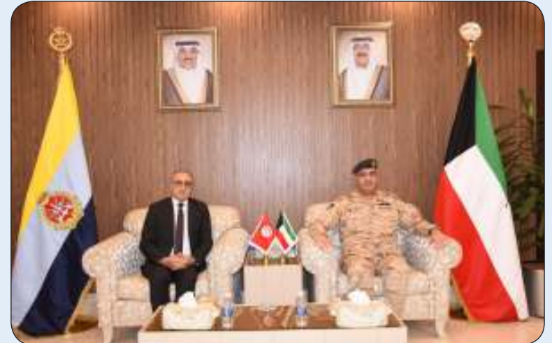
رئيس الأركان العامة وسفير جمهورية تونس لدى البلاد

استقبل رئيس الأركان العامة للجيش الكويتي الفريق الركن طيار بندر المزين أمس الثلاثاء سفير جمهورية تونس لدى دولة الكويت محمد البودالي. وقالت رئاسة الأركان في بيان صحفي إنه تم خلال اللقاء تبادل الأحاديث الودية