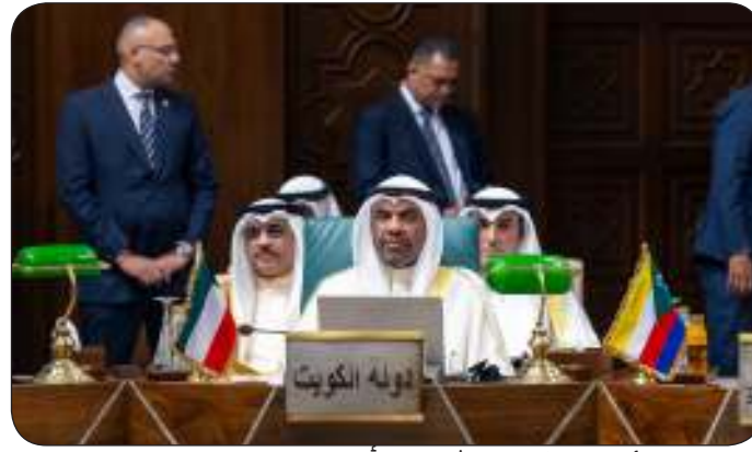
الجحيا مترأساً وفد الكويت المشارك في أعمال اجتماع مجلس جامعة الدول العربية