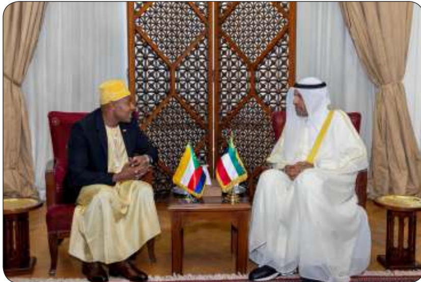
وزير الخارجية ومع نظيره في جمهورية جزر القمر مياي محمد

وكان وزراء الخارجية العرب قد عقدوا اجتماعاً تشاورياً مغلقاً أمس الثلاثاء بمقر الأمانة العامة لجامعة الدول العربية بحضور الأمين العام أحمد أبو الغيط وذلك قبيل انطلاق أعمال الدورة العادية لـ 162 لمجلس الجامعة على المستوى الوزاري.