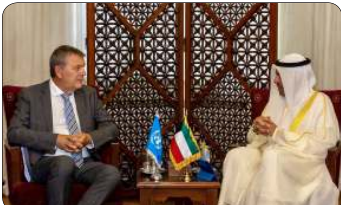
وزير الخارجية ملتقياً وكيل الأمين العام للأمم المتحدة والمفوض العام لـ (اونروا)

أعربت وزارة الخارجية أمس الثلاثاء عن إدانة دولة الكويت واستنكارها الشديد للمجزرة الجديدة التي ارتكبتها قوات الاحتلال الإسرائيلي ضد الأبرياء الفلسطينيين النازحين في منطقة خان يونس جنوب قطاع غزة. وشددت "الخارجية" في بيان على أن هذا "الاستهداف الوحشي للمدنيين العزل من نساء وأطفال لهو دليل دامغ