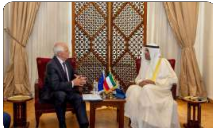
الجحيا ونائب رئيس المفوضية الأوروبية