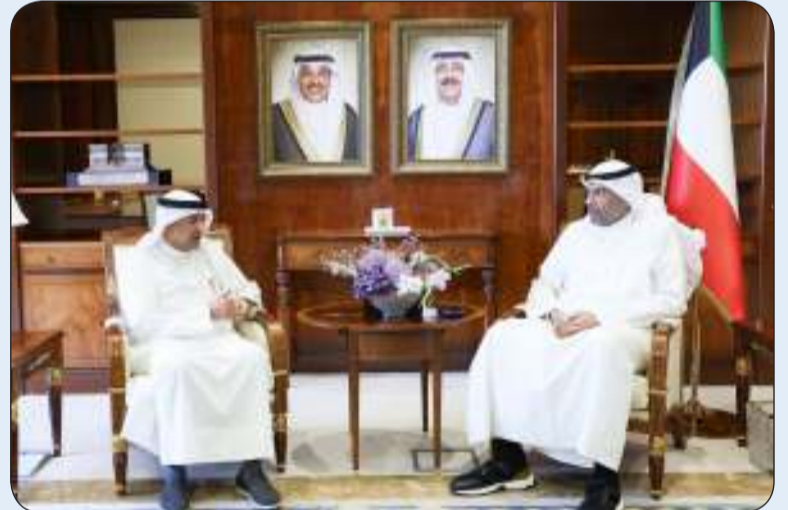
اليحيا ملتقيا البيديوي

التقى وزير الخارجية عبدالله اليحيا أمس الخميس بالأمين العام لمجلس التعاون لدول الخليج العربية جاسم البيديوي حيث تم خلال اللقاء مناقشة أوجه تعزيز الجهود الداعمة لمسيرة العمل