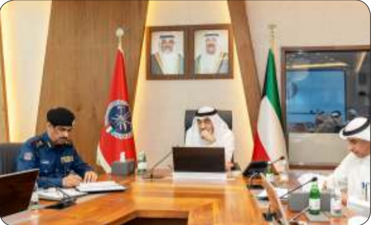
ويشهد لحظة التوقيع