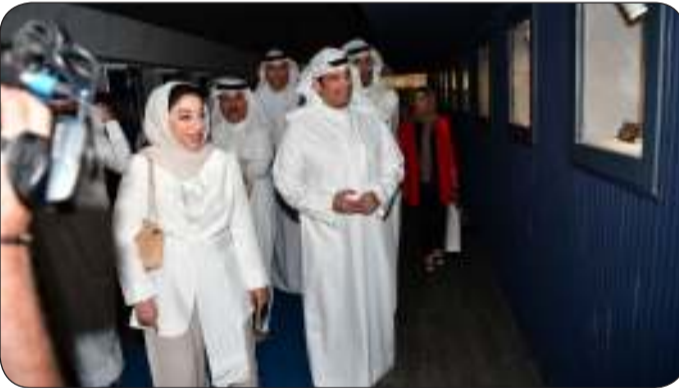
وخلال جولتهما في متحف الإعلام