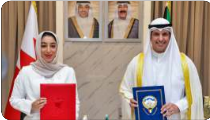
الوزير المطيري ووزيرة السياحة البحرينية بعد توقيع الاتفاقية

السياحة البحرينية فاطمة الصيرفي لكونا حرص البحرين على تعزيز التعاون السياحي بين البلدين الشقيقين في إطار دفع التعاون الخليجي في قطاع السياحة الواعد لآفاق أرحب بما يرفع معدلات السياحة البيئية ويساهم في خلق منظومة سياحية خليجية متكاملة وتعزيز مساهمة قطاع السياحة في اقتصاد المنطقة.