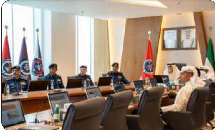
اليوسف يستمع إلى شرح حول آلية الاتفاقية