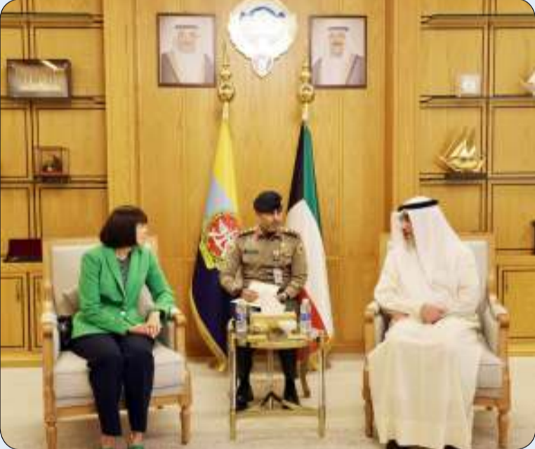
النائب الأول مستقبلا سفيرة الولايات المتحدة الأمريكية

بحث النائب الأول لرئيس مجلس الوزراء ووزير الدفاع ووزير الداخلية الشيخ فهد اليوسف أمس الاثنين مع سفيرة الولايات المتحدة الأمريكية لدى البلاد كارين ساساهارا سبل تعزيز التعاون الدفاعي بين البلدين وقالت "الدفاع" في بيان صحفي إن الشيخ فهد اليوسف استقبلت السفيرة ساساهارا في مكتبه بمقر الوزارة وجرى خلال اللقاء تبادل وجهات النظر تجاه العديد من القضايا والموضوعات ذات الاهتمام المشترك وسبل تعزيز التعاون الدفاعي بين البلدين الصديقين.