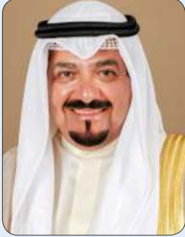
سمو رئيس مجلس الوزراء

تلقي سمو الشيخ أحمد العبدالله رئيس مجلس الوزراء اتصالا هاتفيا أمس من رئيس المجلس الأوروبي شارل ميشيل بحثا خلاله سبل تطوير العلاقات الثنائية بين دولة الكويت ودول الاتحاد الأوروبي وتعزيز أوجه التعاون في مختلف المجالات التي تخدم مصالح الجانبين.