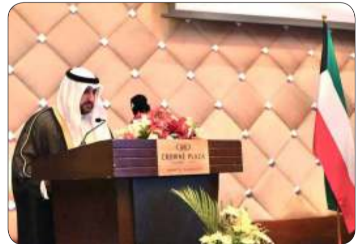
الشيخ عبدالله المشعل يلقي كلمته

وقال وكيل وزارة الدفاع إن الجانبين أحرزا بالجوانب العسكرية تقدما وتوافقا ملحوظا في مجالي التعليم والتدريب العسكري ومثال على ذلك مصنع السلاح والأذخيرة بهيئة الإمداد والتموين. وأفاد بأن المشاركة في الجيش الكويتي.