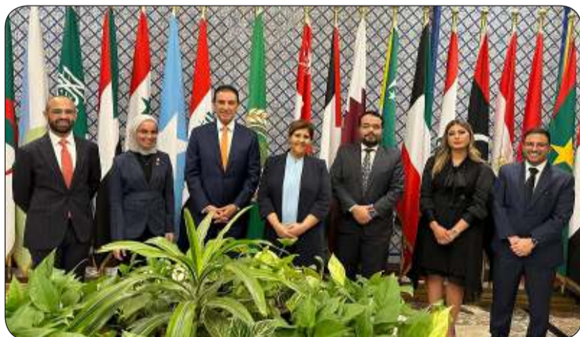
السفيرة الشبيخة جواهر الصباح في صورة جماعية خلال مشاركتها بالاجتماع

في تقارير الأمم المتحدة الدورية. وأكدت على دور اللجنة الحيوي في ترسيخ ونشر ثقافة حقوق الإنسان من خلال إقامة الفعاليات ذات الصلة بحقوق الإنسان والاجتماعات الدورية. وفيما يتعلق بالميثاق العربي لحقوق الإنسان أشارت الشبيخة جواهر الى أهمية دور لجنة الميثاق العربي في نشر ثقافة حقوق الإنسان واتخاذ التدابير اللازمة في الدول العربية عبر تبادل الخبرات. وبينت أن دولة الكويت ستقدم تقريرها الدوري الثاني بحلول نهاية هذا العام الى لجنة الميثاق العربي لحقوق الإنسان.