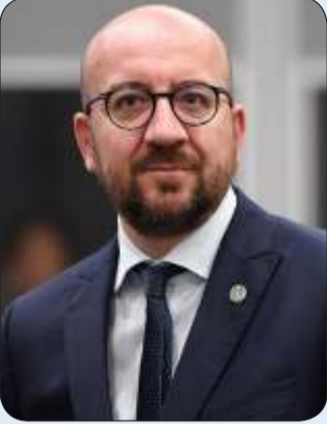
رئيس المجلس الأوروبي