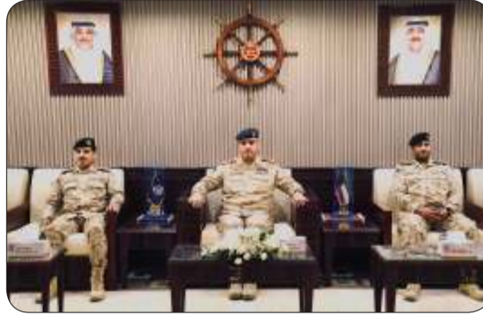
جانب من الزيارة

هذا النهج وتعزيز القدرات من خلال التدريب المستمر والتطوير الذاتي. وأكد بأن القيادة الرشيدة تولي اهتماما كبيرا لتوفير كافة الإمكانيات التي تضمن التفوق والجاهزية الدائمة لقواتنا المسلحة، سائلا المولى أن يحفظ وطننا الغالي ويدعم علينا نعمة الأمن والأمان في ظل قيادة حضرة صاحب السمو أمير البلاد القائد الأعلى للقوات المسلحة حفظه الله ورعاه وولي عهده الأمين حفظه الله.