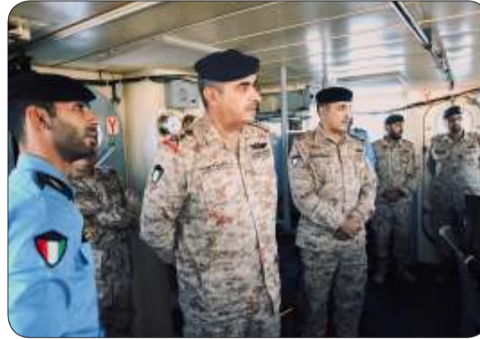
ويطلع على خطة العمل