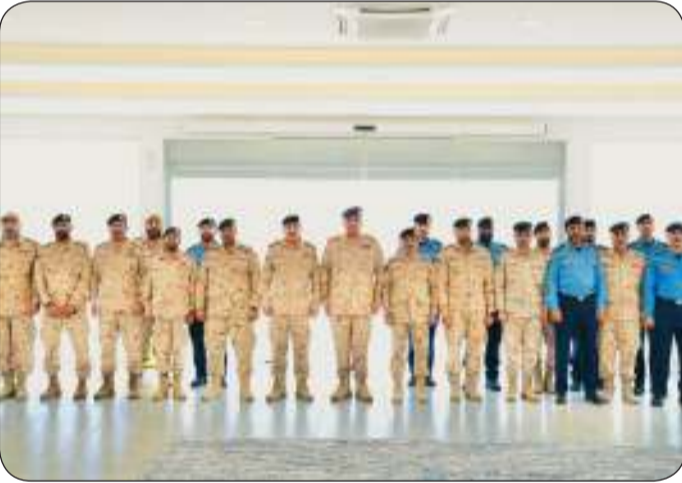
وفي لقطة جماعية مع عدد من الضباط

البحرية، مع بيان درجة الجاهزية والإستعداد بالإضافة إلى الخطط المستقبلية وبرامج التدريب والتأهيل التي لمنتسبيها. شملت زيارة المزين جولة ميدانية مختلف وحدات القوة البحرية، وفي ختام الزيارة عبر