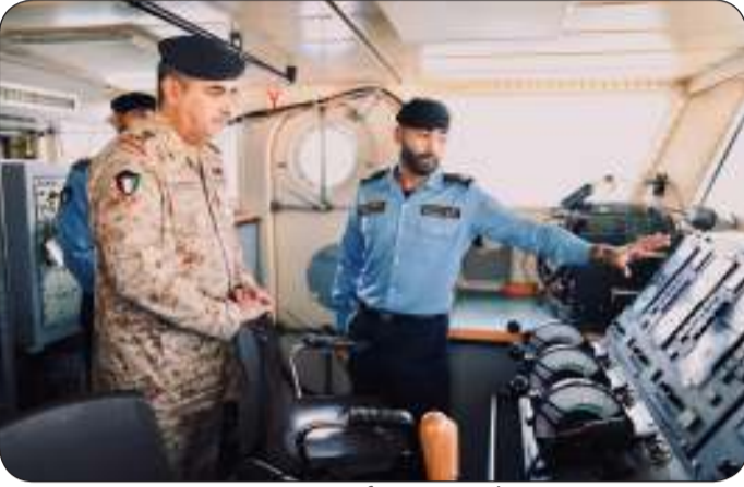
المزين يستمع لشرح حول الأدوات الملاحية المتطورة للرمد