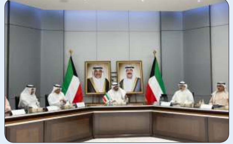
اليحيا مجتمعا بالبيديوي

اجتمع وزير الخارجية عبدالله اليحيا أمس الخميس مع الأمين العام لمجلس التعاون لدول الخليج العربية جاسم البديوي وبحضور نائب وزير الخارجية السفير الشيخ جراح الجابر ومساعد وزير الخارجية في مبنى وزارة الخارجية.