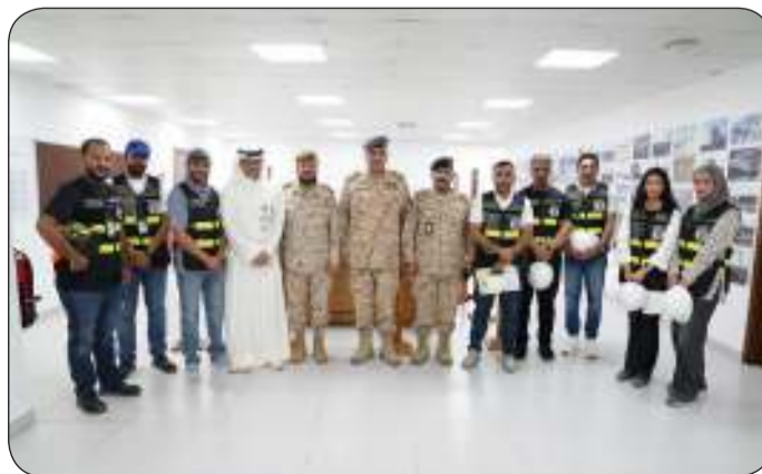
■ المزين يتوسط الصورة الجماعية