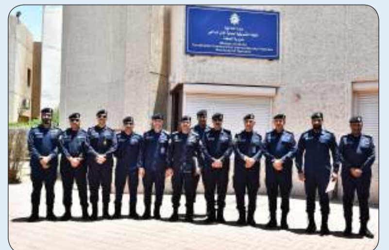
■ صورة جماعية