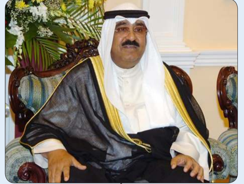
■ سمو أمير البلاد

بعث سمو أمير البلاد الشيخ مشعل الأحمد ببرقية تهنئة إلى أخيه الرئيس اسماعيل عمر جيله رئيس جمهورية جبوتي الشقيقة عبر فيها سموه عن خالص تهانيه بمناسبة العيد الوطني لبلاده. تمنينا سموه له موفور الصحة ومماثلتين. والعافية ولجمهورية جبوتي وشعبها الشقيق كل التقدم والازدهار. وبعث سمو ولي العهد الشيخ صباح الخير الشقيقة عبر فيها سموه عن رئيس مجلس الوزراء ببرقيتي تهنئة