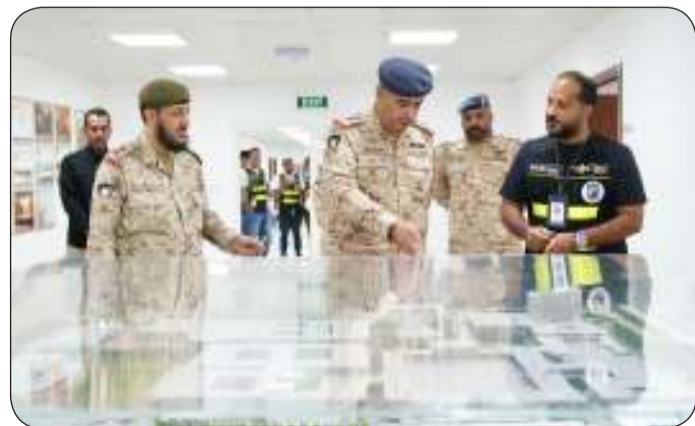
■ رئيس الأركان مطلعاً على ما كيت المشروع