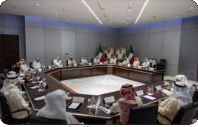
■ جانب من الاجتماع