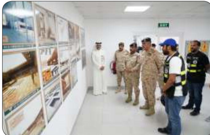
■ رئيس الأركان خلال زيارته كلية «علي الصباح» العسكرية الجديدة