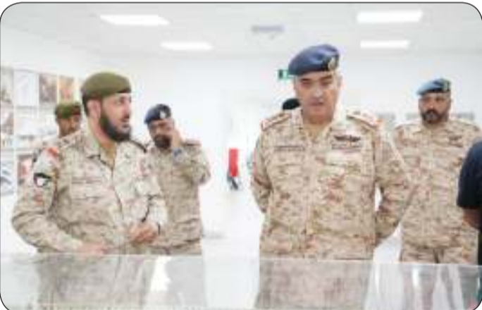
■ جانب من الزيارة