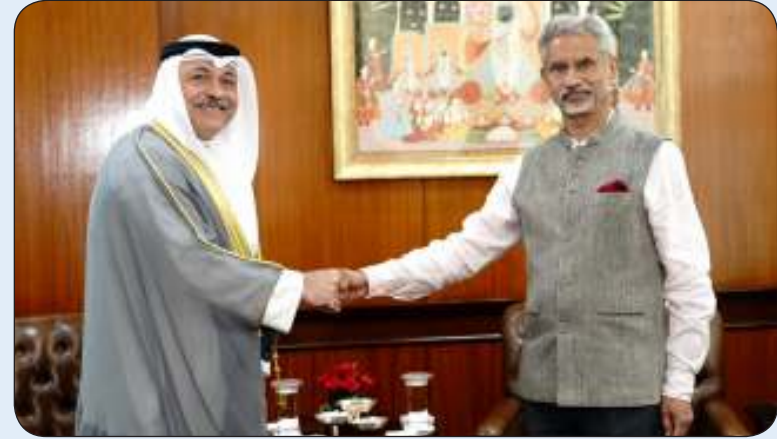
الشيخ فهد اليوسف خلال استقباله السفير الإماراتي لدى البلاد

البلدين على جميع المستويات ستتخللها مشاورات سياسية واجتماعات مشتركة تغطي مختلف القطاعات العاملة في كلا البلدين.