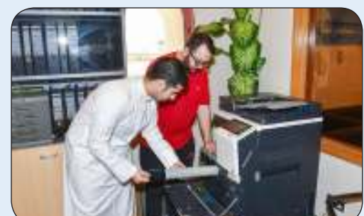
الطلبة المتدربون ضمن برنامج التدريب الميداني في كونا

استضافت "كونا" عدداً من الطلبة المتدربين من الهيئة العامة للتعليم التطبيقي والتدريب ضمن برنامج التدريب الميداني للهيئة قبيل تخرجهم للعام الدراسي 2023-2024. ويندرج التعاون بين "كونا" و"التطبيقي" ضمن الشراكة والتكامل بين مختلف الوزارات والهيئات في الدولة والعمل المشترك للنهوض بالمجال التعليمي والتدريب في البلاد وانطلاقاً من المسؤولية الاجتماعية التي تأخذها وكالة "كونا" على عاتقها ضمن رسالتها