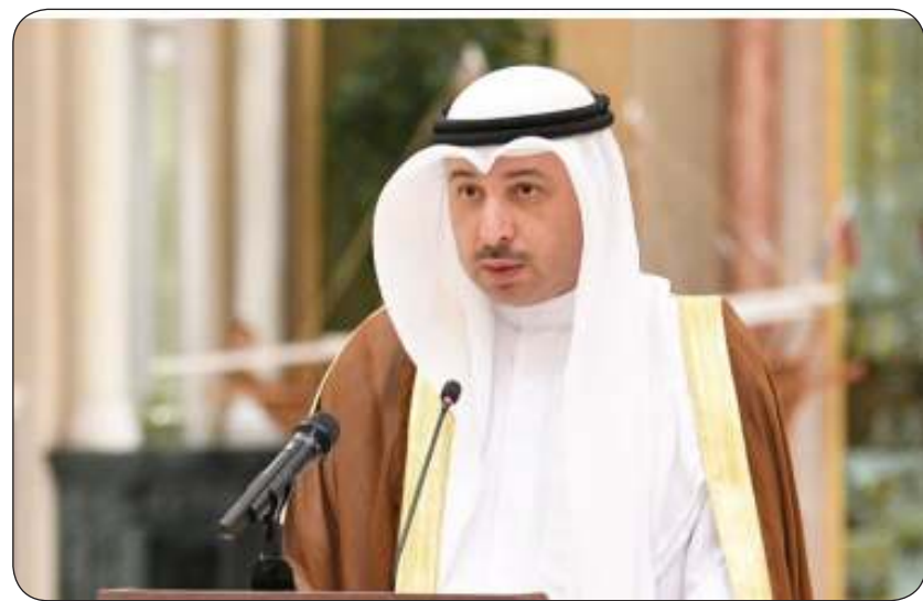
السفير ناصر الهين

الدولي على زيادة الدعم المالي والسياسي لوكالة "أونروا" ولا سيما في الظروف الراهنة بهدف مساعدة الوكالة للوفاء بالولاية المناطة بها. وتحطرق السفير الهين في كلمته إلى استمرار العدوان الوحشي والسافر من قبل القوة القائمة بالاحتلال في غزة ورفع والتي لا يمكن وصفها إلا بالانتهاك الصارخ لكافة الأعراف والقوانين الدولية والإنسانية. وقال في هذا الصدد إن