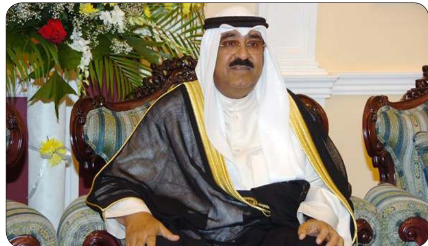
سمو أمير البلاد

متمنياً سموه لها موفور الصحة والعافية ولجمهورية موزمبيق وشعبها الصديق كل التقدم والازدهار. وبعث سمو ولي العهد