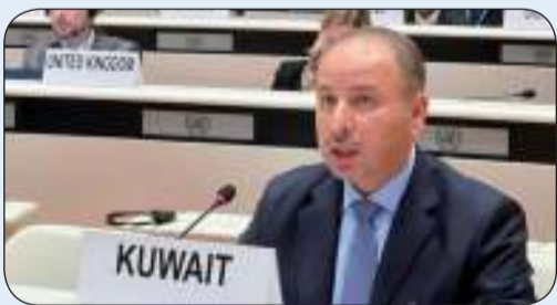
السفير ناصر الهيني

متفق على أن الموقف الذي يشهده المجتمع الدولي بأسره يعتبر دقيقاً نظراً لما يجري اليوم من ممارسات ترتكب بحق الفلسطينيين في غزة وأخرها الجريمة الكراهة ضد الأبرياء في مخيم النصيرات". وقال السفير الهيني في كلمة افتتح بها أعمال فعالية تنظمها الكويت مع كل بلجيكا ومنظمة العمل الدولية في قصر الأمم المتحدة بمدينة جنيف السويسرسية بحضور عدد من الدول المانحة لدعم الأراضي الفلسطينية المحتلة إن هذه الفعالية الهامة تعد رسالة تضامن ومؤازرة للضحايا والمثكوبين من الشعب الفلسطيني الشقيق وبشكل خاص في غزة الجريحة". وأضاف أن "الجميع