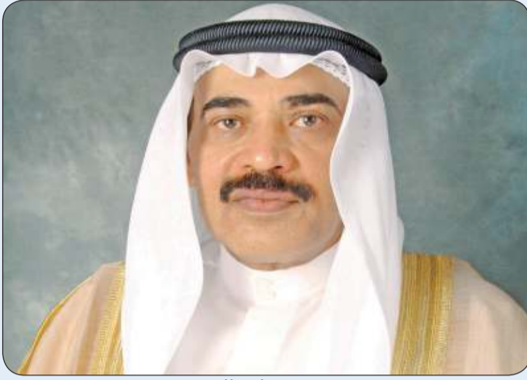
سمو ولي العهد

بحفظ الله ورعايته، يغادر سمو ولي العهد الشيخ صباح الخالد والوفد الرسمي المرافق لسموه أرض الوطن اليوم الثلاثاء متوجهاً