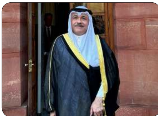
سفير دوله الكويت لدى الهند مشعل الشمالي

نيودلهي - "كونا": أعرب سفير دولة الكويت لدى الهند مشعل الشمالي عن أمله في أن تشهد العلاقات الهندية - الكويتية ازدهاراً في الفترة الجديدة لحكومة رئيس الوزراء الهندي ناريندرا مودي. وجاء ذلك في تصريح أدلى به السفير الشمالي لـ "كونا" عقب مشاركته في احتفالات أداء رئيس الوزراء الهندي اليمين