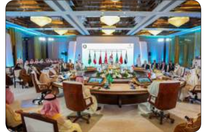
وزير الخارجية مترئساً وفد الكويت في الاجتماع الوزاري