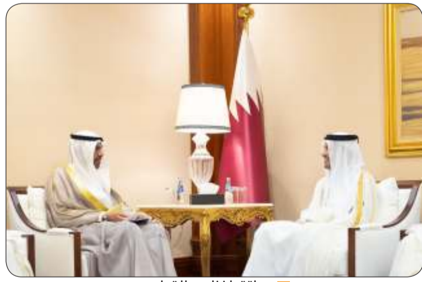
ولتقيا نظيره القطري

على صعيد متصل، التقى اليحيا رئيس مجلس الوزراء وزير خارجية قطر الشيخ محمد بن عبدالرحمن آل ثاني وذلك على هامش اجتماع المجلس الوزاري الـ 160 لجلس التعاون لدول الخليج العربية والاجتماع الوزاري المشترك بين دول مجلس التعاون الخليجي والجمهورية المتحدة في جنيف. وقال اليحيا في كلمة ألقاها أمام الاجتماعات الثلاثية والثنائية، إن دول الخليج وتربطها علاقات مميزة في مختلف القطاعات. وتقدم بالشكر والتقدير لدولة قطر على حسن الاستقبال والتنظيم لهذه الاجتماعات والوزارية التي من شأنها أن تعزز التعاون والتكامل بين دول الخليج بما يحقق رؤية وتوجهات أصحاب الحلالة والسمو قادة دول المجلس.