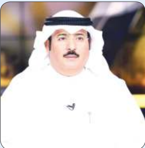
الناطق الرسمي باسم الحكومة عامر العجمي

نفى رئيس قطاع الشؤون المحلية الناطق الرسمي باسم الحكومة عامر العجمي أمس الخميس ما يتم تداوله في وسائل التواصل الاجتماعي عن نية الحكومة تعديل الدوائر الانتخابية أو عدد الأصوات. وقال العجمي لـ «كونا» إن الحكومة لم تقم بدراسة أي مشروع يتعلق بتعديل الدوائر الانتخابية ولا يوجد لديها أي نية لتعديلها مشيرا إلى أن الانتخابات القادمة ستقام بنفس الدوائر السابقة ونظام الصوت الواحد.