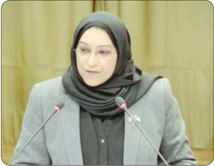
الوزير المفوض تهاني الناصر

هل الاحتلال أصبح شرعيا؟.. الكويت تقول إن هذا الاحتلال غير قانوني وتؤكد على ضرورة توقيفه