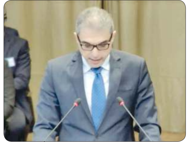
سفير الكويت في لاهاي علي الظفيري مترافعا أمام المحكمة

وكانت الكويت قدمت مرافعة خطية أمام المحكمة بتاريخ 25 يوليو 2023 في هذا الإطار لتفتت بالاهتمام الذي ستوليها محكمة العدل الدولية لمرافعة دولة الكويت وغيرها من مرافعات الدول الشقيقة والصديقة بالإضافة إلى مرافعات المنظمات الدولية بذات الشأن تثبيتا لحقوق ومطالبات الشعب الفلسطيني في إنهاء الاحتلال الإسرائيلي للأراضي الفلسطينية وبشكل فوري.