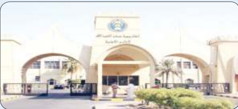
أكاديمية سعد العبدالله

الخليجيين من أبناء الكويتيات للعام الدراسي 2024/2025 وذلك اعتبارا من يوم الثلاثاء الموافق 2024/2/27 وحتى يوم الخميس الموافق 2024/3/28 وذلك عبر الموقع الإلكتروني لوزارة الداخلية.