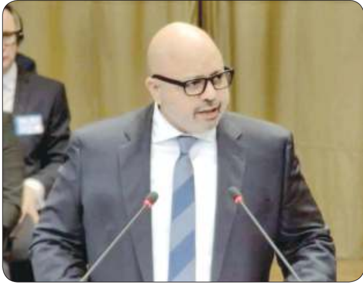
مندوب الكويت الدائم لدى الأمم المتحدة السفير طارق البناي مترافعا