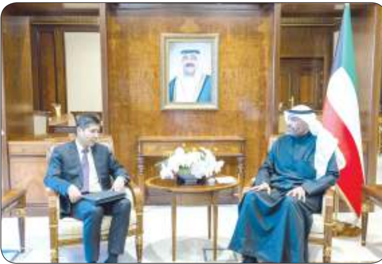
عبدالله اليحيا مستقبلا وانغ دي

التقى وزير الخارجية عبدالله اليحيا أمس الخميس في ديوان عام الوزارة مع مدير عام إدارة غرب آسيا وشمال أفريقيا في وزارة الخارجية بجمهورية الصين الشعبية وانغ دي بمناسبة زيارته الرسمية والوفد المرافق إلى دولة الكويت. وتناول اللقاء عمق علاقات الصداقة التاريخية التي تربط الكويت والصين وبحث أطر مجالات التعاون الثنائي المتعددة في إطار مسيرة الشراكة الاستراتيجية القائمة بين البلدين الصديقين على الصعد كافة والتنسيق المتبادل بما يحقق المصالح