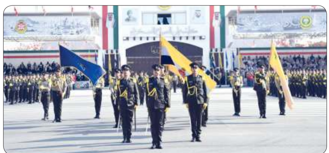
جانب من العروض العسكرية