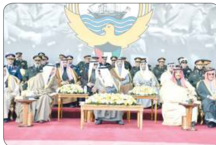
سمو أمير البلاد في حديث مع رئيس مجلس الأمة