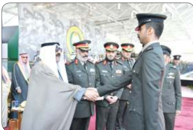
سموه مصافحا أحد الضباط الخريجين