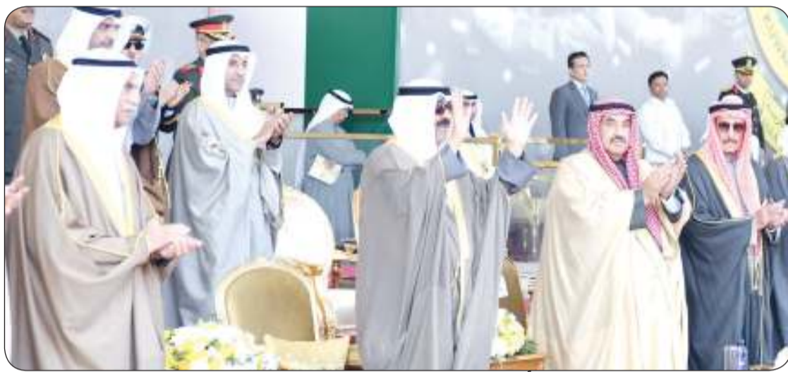
سمو أمير البلاد خلال رعايته وحضوره حفل التخرج

نشمن ما وصل إليه أبناءنا الخريجون من مستوى أكاديمي وعملي يؤهلهم للانضمام إلى إخوانهم منتسبي الجيش الكويتي