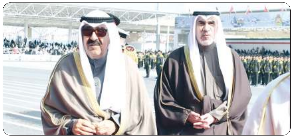
وزير الداخلية باستقبال سمو أمير البلاد

سواء على صعيد تطور الأسلحة وقابليتها أو بحدثة النظريات ومناهج التدريب الميداني العسكري مما يستوجب الاستمرار بالجهود الرامية لمواكبة هذه التطورات والعمل على رفع كفاءة العنصر البشري.