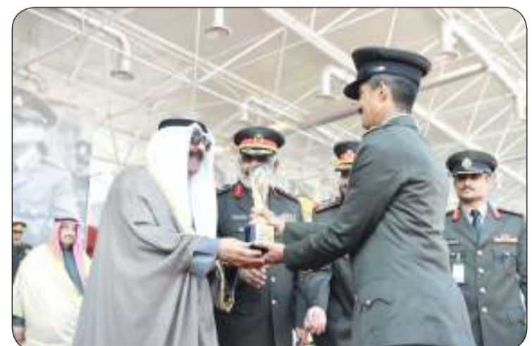
سمو الأمير يكرم أوائل الدفعة