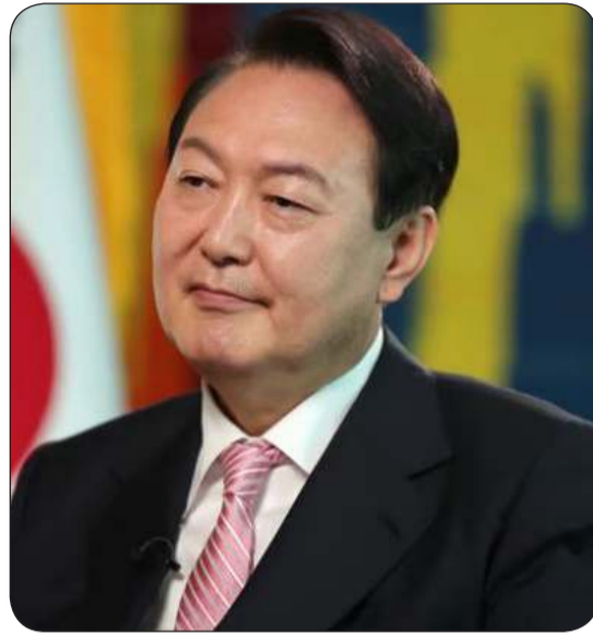
رئيس كوريا الجنوبية