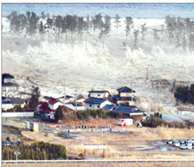
تسونامي اليابان سببه انشقاق كبير في طبقات الأرض

منذ سنتين، شهدت سواحل اليابان ارتفاعا هائلا في منسوب البحر، الأمر الذي أسفر عن نحو حياة الآلاف من البشر في إحدى أكبر الكوارث الطبيعية التي عرفها التاريخ الحديث. وقد ذكرت دراسة منشورة بمجلة «Science» أن الزلزال الهائل قبالة الساحل الشرقي لليابان الذي حدث عام 2011، تسبب في انشقاق بين طبقات الأرض بما مقداره 50 مترا. وهو أكبر ثاني انشقاق تم رصده، والذي قد يكون ناتجا عن زلزال شبلي عام 1960 الذي تراوح حجم الانشقاق فيه بين 30 و 40 مترا، بحسب موقع «روسيا اليوم»، أمس .