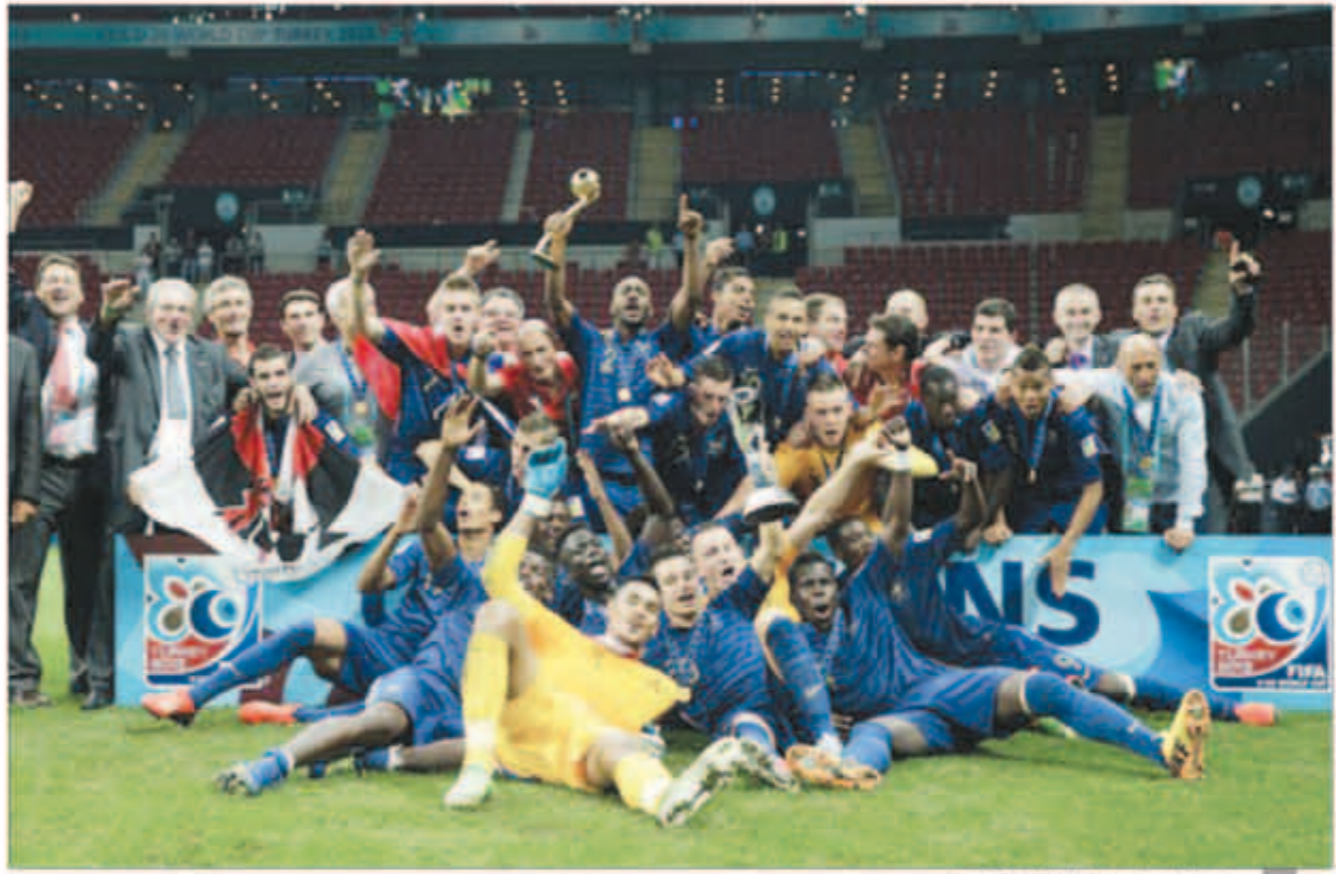
فرنسا تعلن نفسها بطل مونديال الشباب

اقتنص منتخب فرنسا بطولة كأس العالم للشباب بتركيا، والتي أسدل الستار على منافساتها، بتغلبه على أوروغواي 4-1 بركلات الترجيح في المباراة النهائية التي جمعت بينهما على استاد تورك تيليكوم أرينا، ليحرز منتخب «الديوك» اللقب لأول مرة في تاريخه.