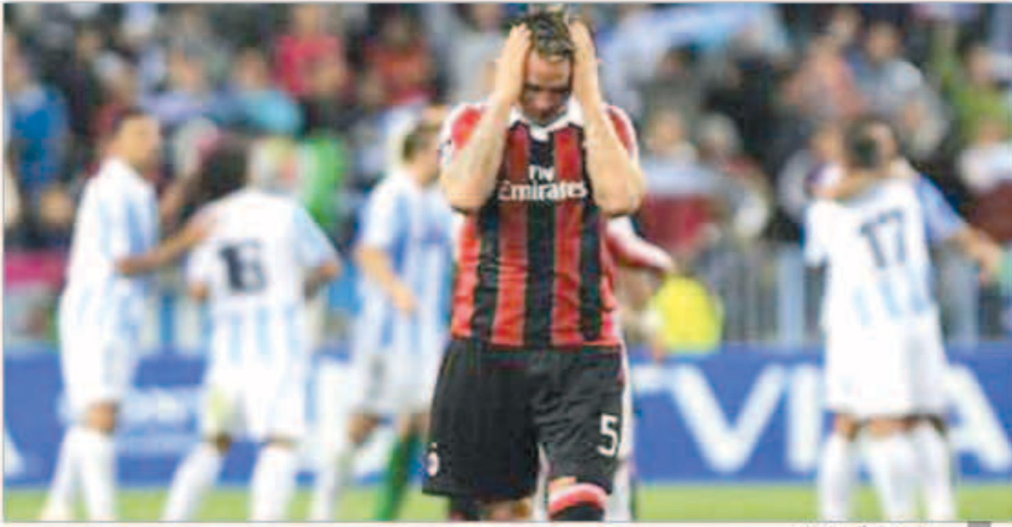
يبدو الحزن على لاعب الميلاق

استعاد النجمان المخضمان الأوروغواي ديبو فورلان والهولندي كلارنس سيدورف ذاكرة التألق في ختام الجولة الثانية والثلاثين من مسابقة الدوري البرازيلي بقيادة فريقيهما إنترناسيونال وبوتافوجو لتحقيق الفوز. وكان إنترناسيونال متأخراً أمام مضيفه فاسكو دا جاما بهدف لجوناس «ق» قبل أن يسجل فورلان «33» عاماً فثانية الفوز «ق» 34 و45 ليرفع رصيد الفريق الأحمر إلى 48 نقطة بالمركز السادس. أما بوتافوجو فتغلب على فيجورينسي قبل الأخير بهدفين دون رد افتتحهما بورنو مندس «ق» 15، واختتمها ابن السادسة والثلاثين سيدورف «ق» 33. ورفع الفوز رصيد بوتافوجو إلى 47 نقطة بالمركز السابع بفارق ثلاث نقاط عن كورينثيانز. ومن المعروف أن فلومينينزي يتصدر المسابقة بفارق ست نقاط عن ملاحقه أنتيتيكو مينيرو.