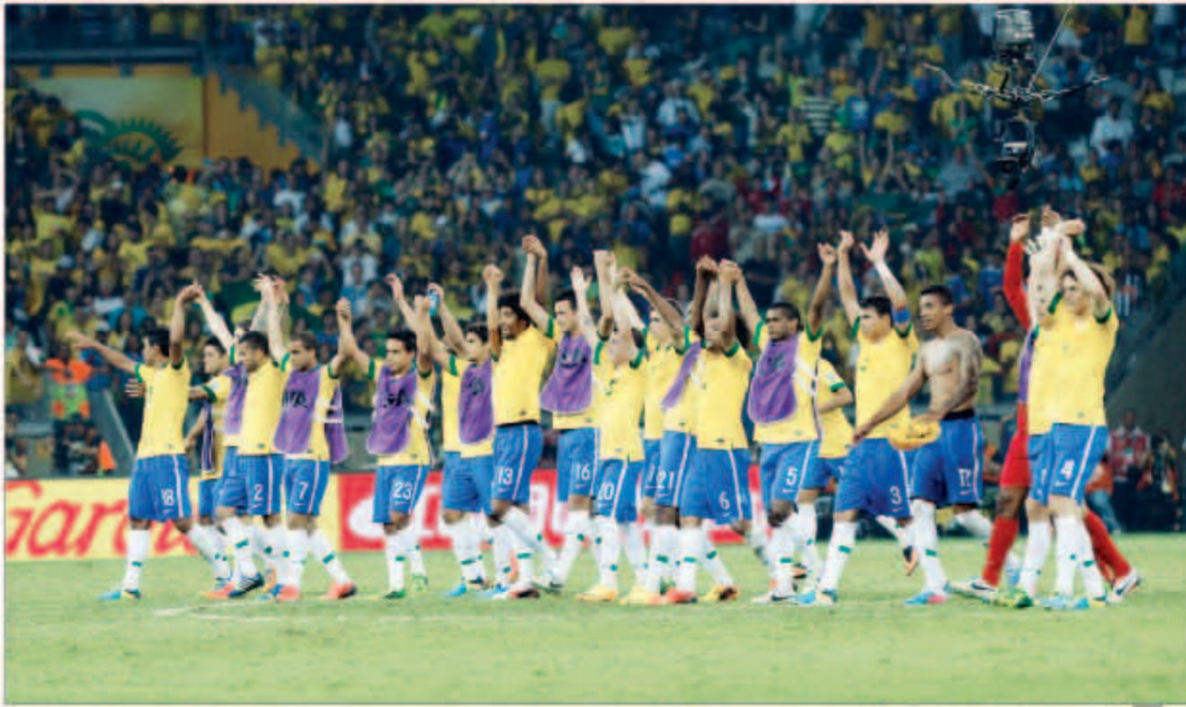
لاعبو البرازيل يوجهون التحية للجمهور

تأهل منتخب البرازيل إلى نهائي بطولة كأس القارات لكرة القدم، والتي تستضيفها على أرضها، بعد تغلبه على منتخب أوروغواي 2-1 في مباراة قبل النهائي التي جمعت بينهما على ملعب مينيراو بمدينة بيلو هوريزونتي، في موقعة جديدة جدد بها تفوقه، وغوض خسارته في موقعة «ماراكانا» الشهيرة التي جمعت بين المنتخبين من 63 عاماً. تقدم المهاجم البرازيلي فريد لمنتخب بلاده بهدف في الدقيقة 48، وتعادل كافاني لأوروغواي في الدقيقة 86. التفوق لسامبيا في الدقيقة 86 بهدف التأهل إلى النهائي، علماً بأن المهاجم الأوروغواياني فورلان كان قد أهدر ركلة جزاء لمنتخب بلاده في الدقيقة 14 تصدى لها سيزار بيراعة. المباراة جاءت تكتيكية على أعلى مستوى، وفرض الالتزام الخططي والحذر من لاعبي الفريقين حرصاً كبيراً على اندامهم في الشوط الأول، فغابت للمحات الفنية، وكانت الكلمة العليا للوقت والسرعة والانتحامات التي أتمس بها اللقاء، وفي الشوط الثاني فرض المنتخب البرازيلي كلمته مع أداء دفاعي متقن من أوروغواي والاعتماد على الهجمات المرتدة، في محاولة لإطالة زمن اللقاء، لكن جاء هدف باولينهو في وقت قاتل ليطيح بأحلام «السماعي».