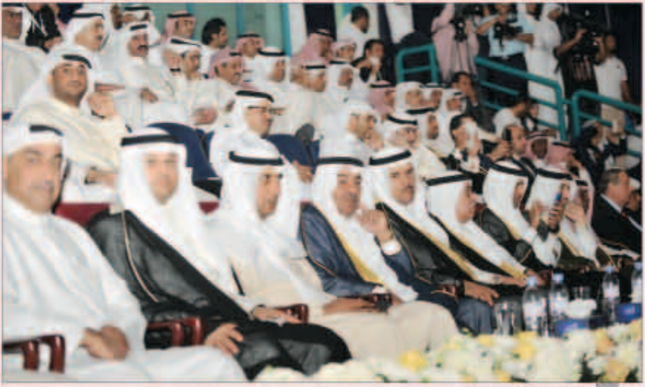
جانب من كبار الحضور