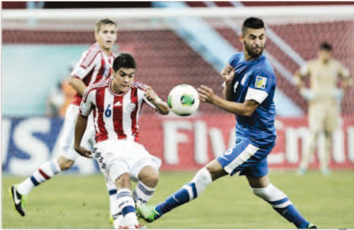
جانب من مباراة باراغواي واليونان