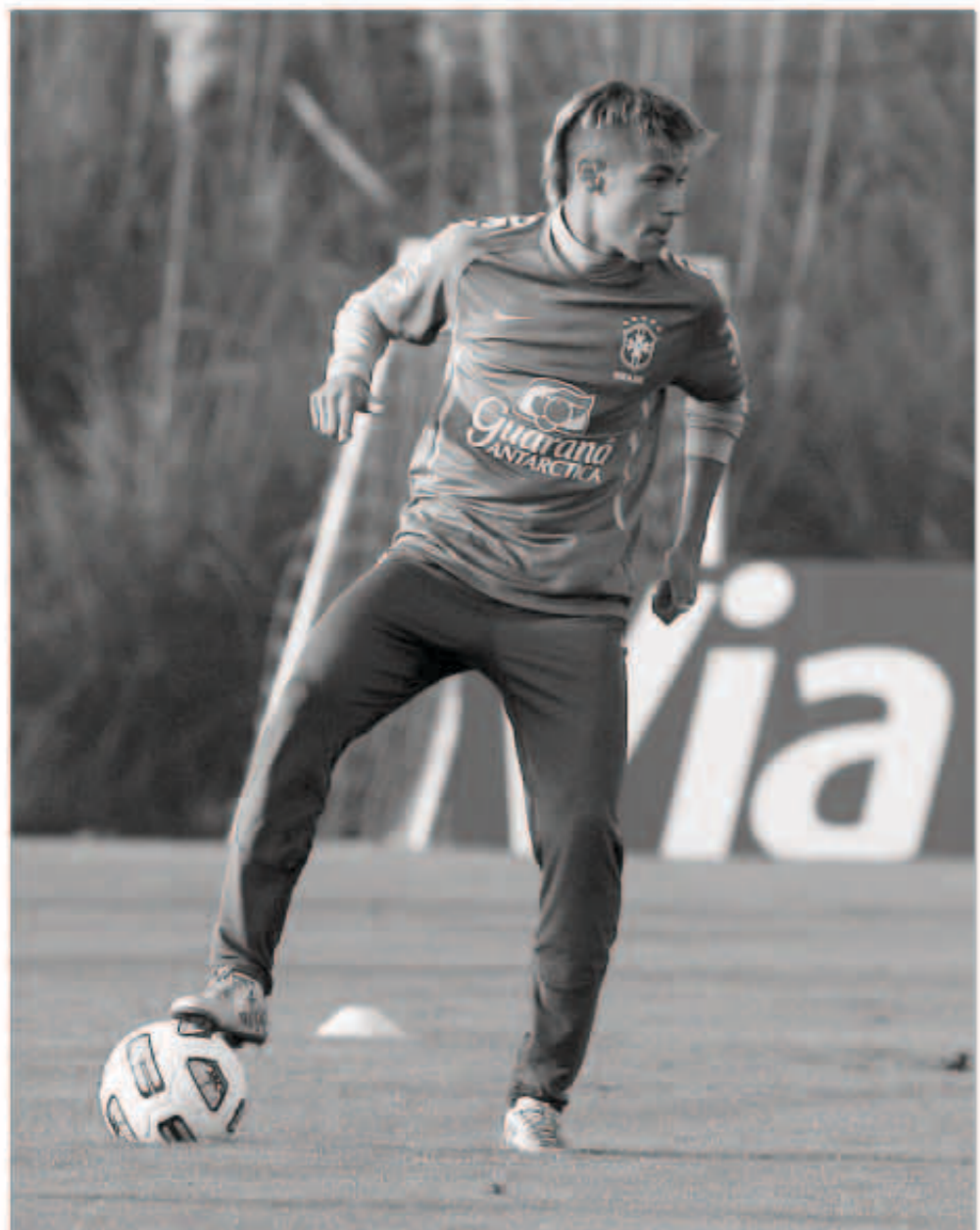
نيمار أمل البرازيل بالمونديال