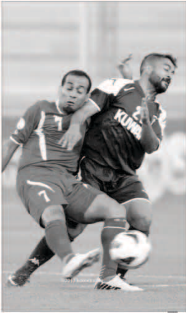
المشعان وذيب في صراع على الكرة

ولعب الجانبان المباراة وفق نظام التبديلات المفتوحة دون أن يتم تحديد عدد معين لكل فريق ولذلك فإن اللقاء لن يدخل في حسابات الاتحاد الدولي «فيفا» الذي يشترط ستة تبديلات لكل منتخب بحد أقصى لاعتماد المباراة ما يعني عدم تأثر تصنيف الأردن والكويت بالنتيجة.