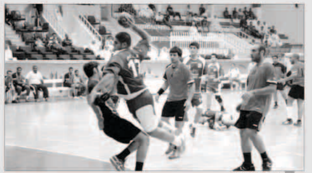
العربي في لقاء سابق

التجنية وتحقيق التعادل لينتهي الشوط بتعادل الفريقين ب13 هدفا لكل منهما. وعاد لاعبو العربي الى املاك زمام المبادرة مع بداية الشوط الثاني وتمكنوا من التقدم بنتيجة 21 - 18 عند الدقيقة ال17 مع استمرار السيطرة على مجريات المباراة لينهوها لصالحهم بكل جدارة واستحقاق. واقيمت مباراة أخرى مساء اول امس ايضا ضمن الجولة الثالثة تغلب فيها نادي الساحل على نظيره اليرموك بنتيجة 30 - 23 بعد ان استطاع خلالها لاعبو الاول من املاك اللعب والنتيجة وتمكنهم من اثناء الشوط الاول لمصلحتهم بنتيجة 14 - 10.