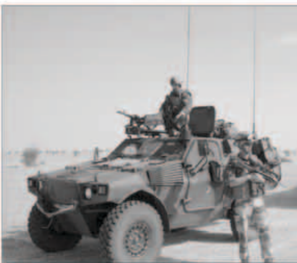
جنود فرنسيون في أفريقيا الوسطى

أفريقيا الوسطى. ويقول مراسلون إن القوات الأفريقية أثبتت أنها قادرة على التدخل بفاعلية لفرض الأمن في النزاعات، إلا أنها بحاجة إلى مزيد من الأسلحة والتدريب والتنسيق. ويسود اعتقاد بان أعمال العنف التي اندلعت يوم الخميس، بدأت عندما شنت مليشيات مسيحية موالية للرئيس المخلوع فرانسوا بوزيزه هجمات عدة، ما أثار هجمات انتقامية منها مسلحون موالون للسلطات الجديدة، وغالبية من المسلمين. وبدأ الاضطراب في أفريقيا الوسطى في مارس، عندما نصب ميشيل غوتوبيا - الذي خلع الرئيس فرانسوا بوزيزي - نفسه كأول زعيم مسلم للبلد ذي الأغلبية المسيحية.