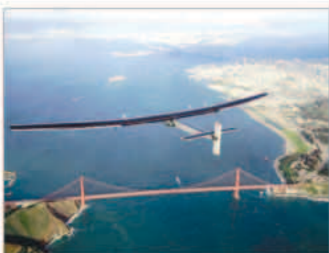
سولار امبالس، 2 قبل كاليفورنيا بعد اجتياز المحيط الهادئ

ساوثن فيو - الولايات المتحدة - «أ ف ب» : حطت الطائرة السويسرية «سولار امبالس» التي تعمل كقط بالطاقة الشمسية في كاليفورنيا أمس في ختام الرحلة التاسعة من رحلتها حول العالم. وكانت الطائرة التي تتسع لشخص واحد فقط ألقت من هاواي الخسيس حلقة فوق مياه المحيط الهادئ، بعدما اضت في تلك الجزيرة قرابة 300 يوم لأصلاح اضرار اصابها بطايراتها الشمسية في المرحلة الثامنة، بين اليابان وهاواي. من رحلتها حول العالم الرامية إلى الترويج لبعثات الطاقة النظيفة، وقال الطيار السويسري برتران بيكار، أحد الطيارين الذين يتعاقبان على قيادتها، قبل حيوطه في جنوب سان فرانسيسكو ،«لقد انتمنا اجتياز المحيط الهادئ، الذي كان خطير مرحلة في الرحلة كلها لخلوء من الأماكن الصالحة للهبوط الاضطرابي» وكانت الطائرة العاملة بالكامل على الطاقة الشمسية والتي تغطي أكثر من 17 ألف خلية ضوئية شمسية جناحيها، انطلقت من ابوظبي في التاسع من مارس 2015، في جولة حول العالم، وتوقفت في سلطنة عمان، ومنها توجهت إلى الهند ثم بورما قبل أن تصل إلى الصين حيث علقت حوالي الشهر، ومنها إلى اليابان قبل الانتقال إلى هاواي.