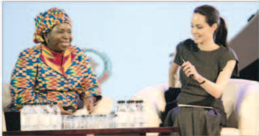
الملكة أنجلينا جولي خلال التلقا.

«فرائس برس»: دعت الملكة أنجلينا جولي رؤساء الدول الإفريقية إلى التحرك، ضد الإفلات شبه الكامل من العقاب الذي يتمتع به مرتكبو جرائم الاغتصاب في مناطق النزاعات المسلحة الخاسرة والعشرين للاتحاد الإفريقي في جوهانسبرغ.