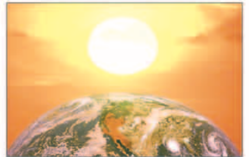
أبريل الأشد حرارة منذ بدء تسجيل درجات الحرارة عالميا قبل 130 عاما

وعرب الخبير عن قلته من النتائج التي ستخلفها درجات الحرارة المرتفعة على البيئة، داعيا إلى المحافظة بشكل أكبر على البيئة، ومواجهة الاحتباس الحراري.