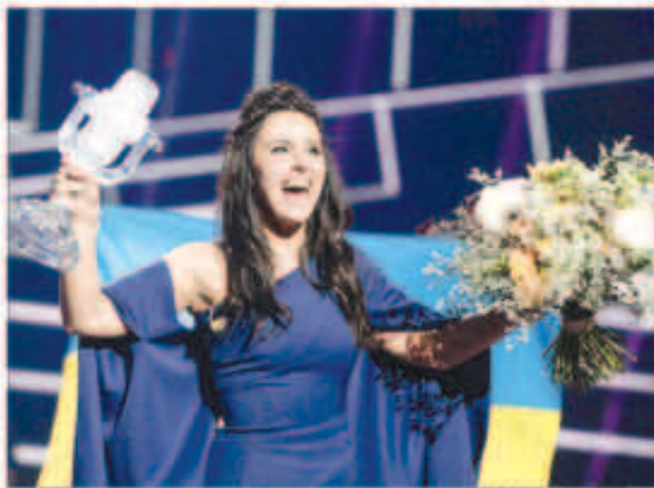
الأوكرانية جمالا بعد فوزها بمسابقة يوروفيجن في ستوكهولم

ستوكهولم - «رويترز» : فازت الأوكرانية جمالا بالمرکز الأول في مسابقة يوروفيجن للأغنية الأوروبية أول أس بأغنية بعنوان «1944» والتي تتناول عمليات الترحيل التي قام بها الاتحاد السوفيتي وقت الحرب لسكان القرم من التتار لتصبح واحدة من أكثر الفائزين إثارة للجدل في تاريخ المسابقة.