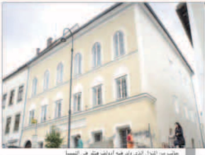
حائب من المنزل الذي ولد فيه أدولف هتلر في النمسا

زوريخ (رويترز) - بعد سنوات من محاولة شراء المنزل الذي ولد فيه الزعيم النازي أدولف هتلر من ماله تعترم الحكومة النمساوية مصادرة المنزل حتى لا يقع في أيدي النازيين الجدد . وقال كارل هاينز جرونديوبوك المتحدث باسم وزارة الداخلية «ينتظر إلى طبيعة البني الفريدة وأهميته التاريخية والصحة العامة قررنا بدء مناقشات سعياً للشروع في اتخاذ الإجراءات القانونية لمصادرة» . وتابع أن القرار اتخذ بعد سنوات من المناقشات والمحاولات غير الجيدة لشراء البني مضيفاً أن ماله سيحصل على تعويض لفقدانه ملكيته . وكان هتلر ولد في المنزل الواقع في منطقة برونو أوم إن في 20 أبريل نيسان عام 1889 . وانخفضه النظام الاشتراكي الوطني الألماني للحماية التاريخية في عام 1938 بعد أن اشترته الحكومة النمساوية . وبعد عودته لعائلة بومر عام 1952 أصبح المنزل ملكاً لجيرلينده بومر عام 1977 . واستأجرت النمسا المنزل منذ عام 1972 واستخدمته كمنزل لرعاية ذوي الاحتياجات الخاصة ولكنه أصبح خالياً منذ عام 2011 بعد أن رفقت عائلة بومر السماح بإدخال تحسينات .