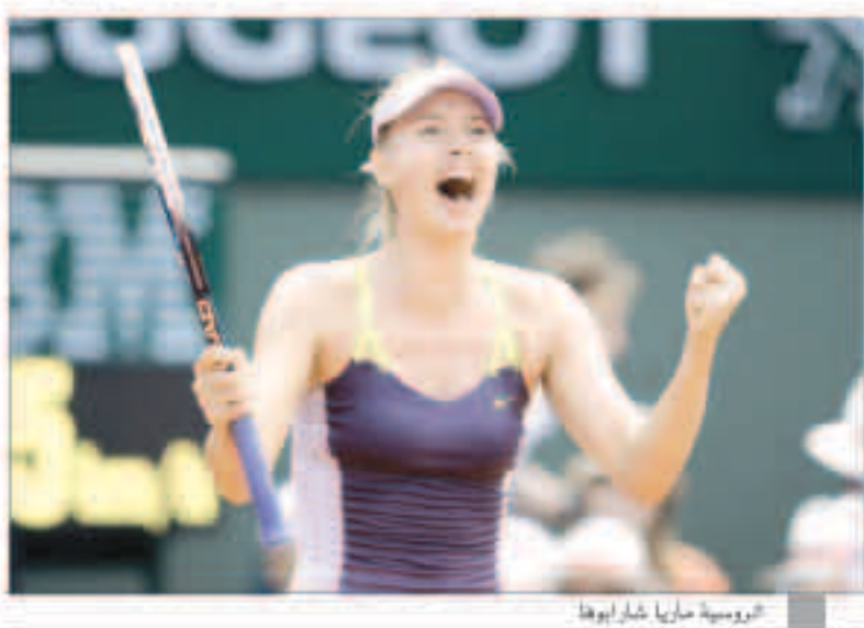
الروسية ماريا شارابوفا

«روبيرتز»: مرة أخرى تصدرت نجمة التنس الروسية ماريا شارابوفا قائمة الرياضيات الأعلى دخلاً خلال العام الأخير حسبما جاء في مجلة فوربز. ويهيأ ثنائي شارابوفا على رأس قائمة الرياضيات الأعلى دخلاً للعام 11 على التوالي في ظل سيطرة لاعبات التنس على سبعة من المراكز العشرة الأولى في القائمة. ولقول فوربز إنه خلال العام الماضي جمعت شارابوفا (28 عاماً) نحو 6.7 مليون دولار من الجوائز لكن إجمالي دخلها المالي خلال هذه السنة بلغ 29.7 مليون دولار تقريباً. واحتلت المصنفة الأولى عالمياً الأمريكية سيرينا وليامز المركز الثاني في القائمة بحصولها على 24.6 مليون دولار تقريباً في حين احتلت رياضية سيارات السيارات الأمريكية نانكا بارتيك المركز الرابع بعد أن بلغ دخلها 13.9 مليون دولار وهي بذلك صاحبة أعلى مركز من خارج لاعبات التنس.