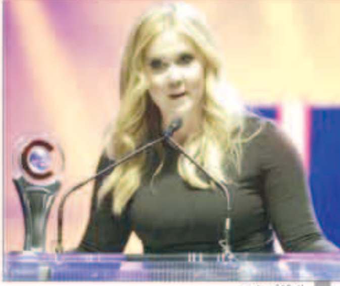
الممثلة أمي شومر

«رويترز» : تخوض الممثلة الكوميدي أمي شومر أول تجربة لها في كتابة الأفلام الروائية الطويلة مع «ترينريك» وهي كوميديا تدور عن الحب والعائلة والرياضة تؤدي فيه دور البطولة النسائية.