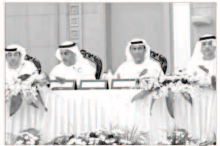
الجمعية العمومية للقدرة

حققت شركة «القدرة القابضة» 43 مليون درهم أرباحاً عن العام الماضي جاء ذلك خلال اجتماع عقدهت الجمعية العمومية العادية للقدرة القابضة في نادي ضباط القوات المسلحة في أبوظبي والذي ناقشت خلاله التقرير المالي والإداري للشركة. وأعدت النتائج الأمل للشركة بمستقبل واعد مبني على أسس ومعايير جديدة لتأمين تدفقات مالية مستدامة من خلال تحويل الشركة من شركة ذات تركيز على المشاريع العقارية إلى شركة استثمارية فعالة تركز على مجالات اقتصادية حيوية. منها قطاع النفط والغاز ومشاريع البتروكيماويات وقطاع الرعاية الصحية والتعليم وقطاع المصارف والتمويل. وتقدم أعضاء مجلس إدارة الشركة بالشكر لكل من قدم العون والدعم للقدرة القابضة في مسيرتها الاستثمارية الناجحة وعلى رأسهم صاحب السمو الشيخ خليفة بن زايد آل نهيان رئيس الدولة «حفظه الله» والفريق أول سمو الشيخ محمد بن زايد آل نهيان ولي عهد أبوظبي نائب القائد الأعلى للقوات المسلحة وسمو الشيخ هزاع بن زايد آل نهيان مستشار الأمن الوطني وسمو الشيخ طحون بن زايد آل نهيان نائب مستشار الأمن الوطني وسمو الشيخ منصور بن زايد آل نهيان نائب رئيس مجلس الوزراء وزير شؤون الرئاسة. كما أعلنت الشركة عن استكمال مملكة استثماراتها كافة بتعيين ممثلين عنها في مجالس إدارات هذه الشركات كما خرجت من عدة استثمارات غير منتجة ولا تتماشى مع سياستها الاستثمارية الجديدة التي تركزت على ضمان تدفق نقدي بصورة مستدامة للشركة. ووافق المساهمون على جمع بنود أجندة الاجتماع وعلى تصورة الأرباح لهذه السنة كما أبدوا رضاهم عن المعايير والأسس الجديدة التي وضعتها الشركة للوصول إلى نتائج تشغيلية أفضل في العام 2013 وتحقيق التطلعات المرجوة لمساهميها ولدولة الإمارات.