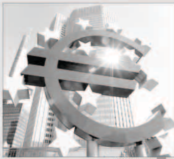
البنك المركزي الأوروبي

عقد مجلس محافظي البنك المركزي الأوروبي اجتماعه السنوي في مدينة فرانكفورت الألمانية، في ظل توقعات متزايدة بتخفيض سعر الفائدة الرئيسية وسط تزايد القلق بشأن آفاق اقتصادات منطقة اليورو والتراجع الحاد لمعدل التضخم.