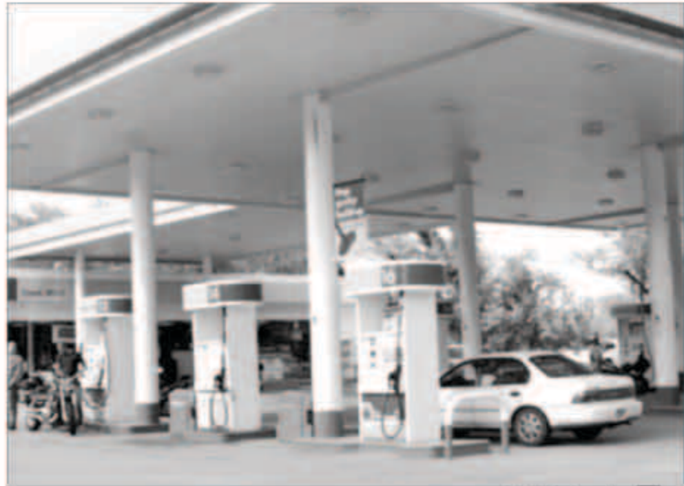
السور، لتسويق الوقود