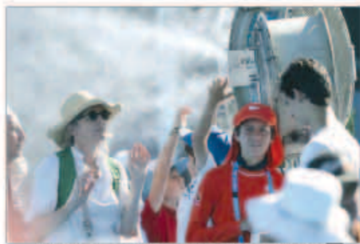
موجة شديدة الحرارة تجتاح أستراليا ودرجات الحرارة تسجل ارتفاعاً قياسياً

سيدني - رويترز: وجهت السلطات الأسترالية تحذيراً للمواطنين من ممارسة الكثير من الأنشطة في الهواء الطلق وتخصّصهم بشرب كميات كبيرة من الماء إذ من المتوقع أن تتحول فتر ذار ارتفاع درجات الحرارة إلى مستويات قياسية في بعض الأنحاء بل وربما تزيد على مدى الأيام المقبلة. وبلغت درجات الحرارة في أجزاء من ولاية نيو ساوث ويلز، أكبر الولايات الأسترالية من حيث عدد السكان، وفي منطقة بولاية أستراليا الغربية إلى درجات صفرى قياسية بلغت 33 درجة مئوية خلال الليل.