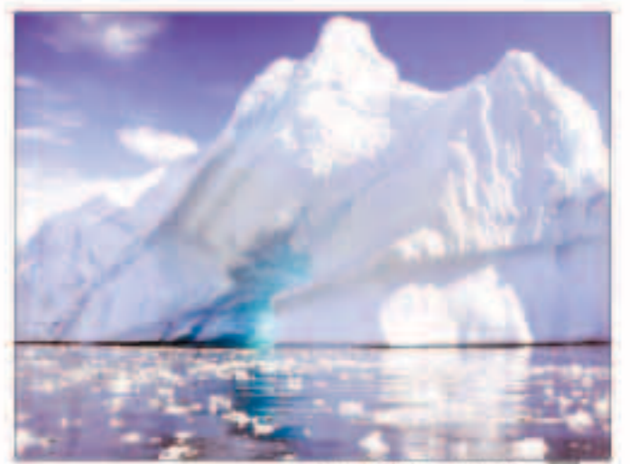
ذوبان الجليد في القارة الجنوبية

واعتمدت الدراسة الجديدة التي نشرت خلاصاتها أمس الأول، على صور جوية دقيقة التقطتها طائرات تابعة لوكالة الفضاء الأميركية (ناسا) وصور من الأقمار الاصطناعية.