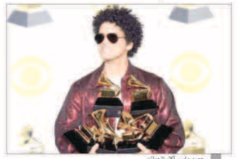
محمد مارس أكثر الجوائز

ولم يحل الحظ من السياسة وإن كان بشكل ساخر، إذ تضمن مشهرا مسجلا لماريا لهيلاري كلينتون وجون ليجنند وشير وكاردي بي وسنوب دوغ وهم يقرأون مقتطفات من كتاب (الغار والغضب) الذي يتناول العام الأول للرئيس دونالد ترامب في البيت الأبيض.