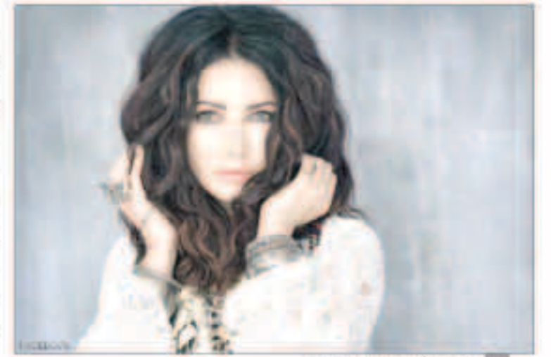
المغنية الأوكرانية ناتاليا دزينيكيف

وولدت ناتاليا دزينيكيف عام 1975، وإضافة إلى الغناء فهي كاتبة الأغاني وتنتجها، وبدأت نشاطها الفني التسعينيات وفي 2005 أسست فرقة «لاما» الموسيقية.