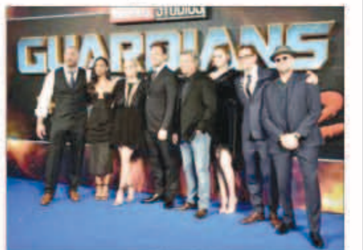
طاقم عمل فيلم جاردريانز أوف ذا جالاكسي، في لندن

الفيلم بطولة فين ديزيل ودوين جونسون ونيريس جيسون ومن إخراج إف. جاري جري.