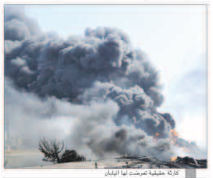
كارثة حقيقة ضربت لها اليابان

وقالوا إن الإجهاد الناتج عن الضغوط وتغيير نمط الحياة تسبب أمراض السمعة وعرض السكري، وزيادة خطر الإصابة بالسكريات الدماغية وأمراض القلب.