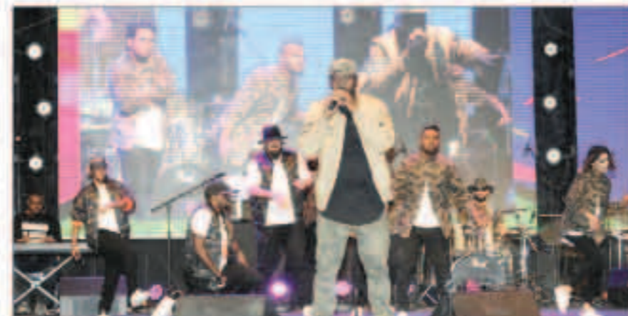
إحدى فقرات الحفل على المسرح الخارجي لحديقة الشهيد