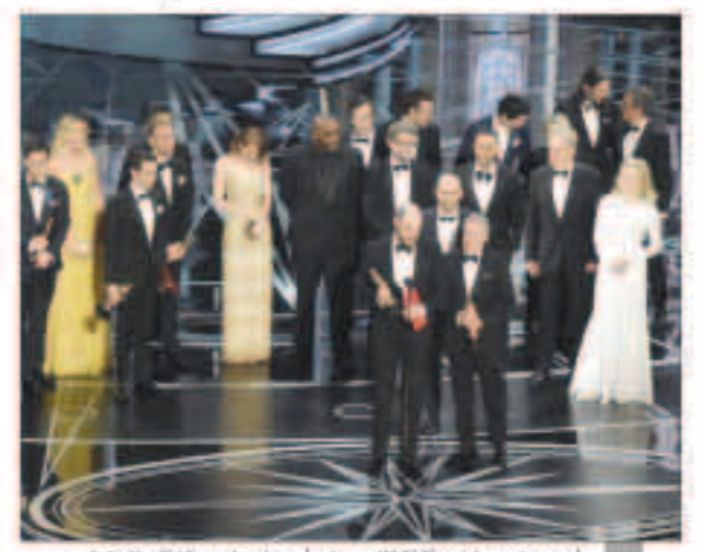
أحد منتحي فيلم «لا لا لاند» يعلن أن فيلمه ليس الفائز الحقيقي

وتابع البيان «بعد وقوع الخطأ لم يتبع السيد كاليمان وزميلته إجراءات التصحيح السليمة بالسرعة الكافية». وقالت صحيفة وول ستريت جورنال وموقع «تي إم زي دوت كوم» المتخصص في أخبار المشاهير إن كاليمان نشر على تويتر من خلف المسرح صورة للممثلة إيما ستون قبل دقائق من وقوع الخطأ.