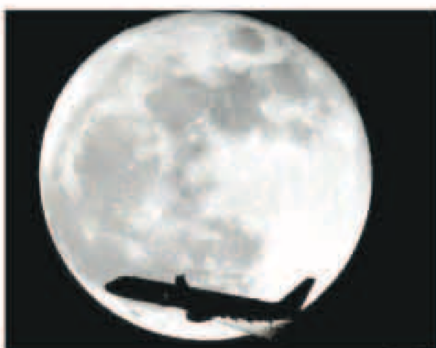
الرحلة تستغرق أسبوعا واحدا

«سكاي نيوز عربية»: قال إيلون ماسك الرئيس التنفيذي لشركة سبيس إكس بورتيفيشن تكنولوجيز إن الشركة تعتزم إرسال سائحين اثنين في رحلة حول القمر في العام القادم ستستخدم سبيس إكس جيري تصميمها لحساب رواد فضاء إدارة الطيران والفضاء الأميركية (ناسا) وصاروخا لم يختر طيراته بعد. وقال ماسك للصحفيين في مؤتمر عبر الهاتف إن من المستهدف مؤقلا أن يكون إرسال أول سائحين في رحلة ممولت بأموال خاصة إلى ما بعد مدار المحطة الفضائية الدولية في عام 2018. وأصبح ماسك عن الكشف عن هوية السائحين أو عن المبلغ الذي سيدفعه الطيران في الرحلة التي تستمر أسبوعا لكنه قال «ليس بينهما أحد من هوليوود». وأضاف أيضا أن السائحين يعرفان بعضهما بعضا. وأضاف قائلا «تتوقع تنظيم أكثر من رحلة من هذا النوع. هذا سيكون مغامرة للغاية». وأوضح ماسك كذلك أنه إذا قررت ناسا أنها ترغب في أن تكون الأولى في مثل هذه الرحلات للطيران حول القمر فإن الأولى ستكون لوكالة الفضاء الأميركية. وتجري ناسا بحسب من إدارة الرئيس الأميركي دونالد ترامب دراسة لتقييم مخاطر السلامة والتكاليف والمزايا المحتملة للسياح لرواد فضاء بالطيران في أول اختبار للطيران لصاروخ تقل لثقل لملحوظة الإطلاق الفضائي وكبسولة الفضاء أوريون.