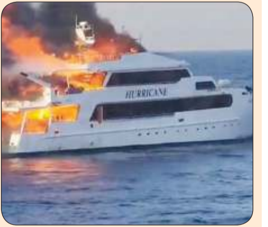
حريق مركب سياحي قرب السواحل المصرية