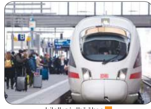
محطة قطار في ألمانيا

يشار إلى أن هيئة السكك الحديدية الألمانية (دويتشه بان) لديها عملياً بالفعل نوع من حظر السكاكين، حيث تنص لوائح النقل الخاصة بها على عدم السماح باصطحاب أي أشياء أو مواد يمكن أن تزج المسافرين أو تصيبهم أو تلحق أضراراً بالعربات. ولكن نقابة الشرطة الألمانية ترى أن مثل هذا الحظر لا يمكن السيطرة عليه ومراقبته.