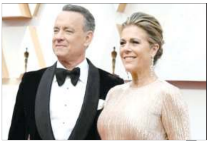
توم هانكس وزوجته ريتا ويلسون

وكان هانكس وويلسون قد أصيبا بـ«كورونا» في أثناء وجودهما في أستراليا بداية شهر مارس الماضي، ونقلا إلى المستشفى لفترة وجيزة قبل أن يخضعا للعزل الذاتي في المنزل. وفي نهاية مارس، عاد الزوجان إلى لوس أنجلوس بعد تعافيهما من المرض. وخلال المقابلة مع «توداي شو» شدد هانكس على أن أحد الجوانب الحاسمة في معركته مع الفيروس، هو أنه قام هو وويلسون بالخضوع للعزل المنزلي «من أجل السيطرة على العدوى ومنع نقلها للآخرين».