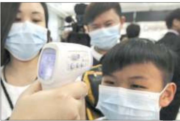
طفل يخضع لفحص درجة حرارة الجسم في كولومبيا

وقالت ويندي باركلي، وهي أستاذة أخرى في المجموعة الاستشارية ومتخصصة في علم الفيروسات في لندن إمبريال كوليدج إن من بين الطفرات في السلالة الجديدة تغيرات في طريقة دخولها الخلايا البشرية التي قد تعني «أن الأطفال، ربما قد يكونون معرضين كذلك للإصابة بهذا الفيروس مثل البالغين».