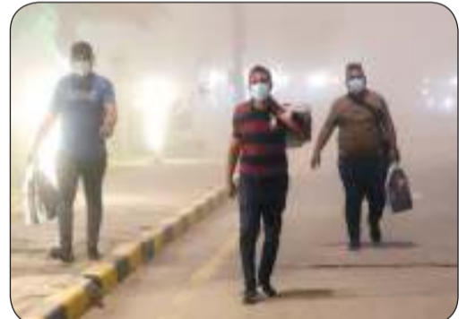
من العاصفة الترابية التي اجتاحت العراق

أفادت مصادر طبية عراقية بأن عدد المصابين بحالات الاختناق جراء العاصفة الترابية التي اجتاحت العراق زاد عن 2750 حالة، تركزت شدتها في جنوبي البلاد. وأوضحت المصادر الطبية أن جميع المستشفيات العراقية دخلت في حالة استنفار قصوي، بعد اشتداد حالة العواصف الترابية في مناطق متفرقة من البلاد، مما تسبب بزيادة حالات الإصابة بالاختناق التي تجاوزت 2750 حالة تم تقديم الخدمات الطبية لهم. وبحسب بعض المصادر فإن عدد المصابين بحالات الاختناق الذين تم تسجيلهم في محافظة ميسان بلغ 656 حالة توزعوا على 12 مستشفى وطوارئ منتشرة في المحافظة. كما سجلت دوائر الصحة في خمس محافظات أكثر من ألفي حالة اختناق حتى الآن، بينها 749 في البصرة، و700 في المنفي، و322 في الديوانية، و174 في ذي قار، و150 في النجف. وقال عامر الحابري المتحدث باسم هيئة الأنواء الجوية في تصريح صحفي إن "موجة الغبار التي ضربت البلاد تعود إلى حالة من عدم الاستقرار الجوي لا سيما تذبذب درجات الحرارة خلال هذه الفترة وأن العاصفة اجتاحت مناطق واسعة من وسط وجنوب وغربي البلاد، نتيجة رياح سطحية قادمة من شرقي السعودية وجنوب غربي العراق، ما أدى إلى تدهور الرؤية الأفقية إلى أقل من كيلومتر واحد، وإنعدامها في العديد من المناطق".