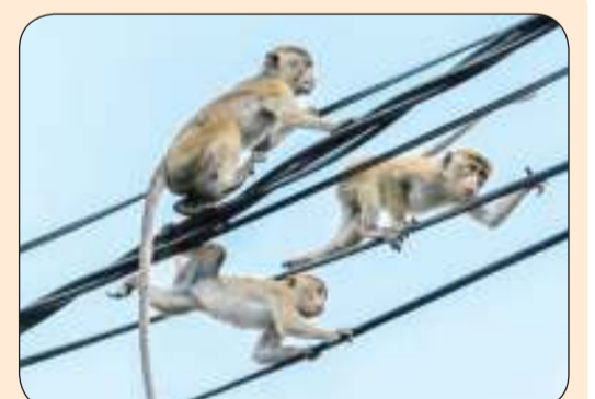
قردة على أسلاك كهربائية في مدينة أنورادابورا في وسط سريلانكا الشمالي

وأدلى ماسك بهذه التصريحات، وهي الأولى له بشأن موضوع شراء تيك توك، في مؤتمر في ألمانيا