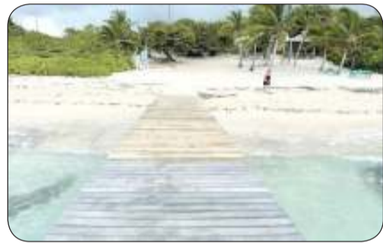
من شواطئ البحر الكاريبي

ضرب زلزال بقوة 7.6 درجات البحر الكاريبي، حسب هيئة المسح الجيولوجي الأمريكية، ما استدعى إطلاق تحذير من موجات تسونامي، خاصة في كوبا، وجامايكا، والمكسيك، وكوستاريكا، وهايتي. وهز الزلزال قلب البحر الكاريبي. كما تأثرت بالتحذير من أمواج تسونامي، جزر كايمان، وهندوراس، وجزر البهاما، وبليز، وبنما، ونيكاراغوا، وغواتيمالا، وفق مركز التحذير من أمواج التسونامي في المحيط الهادئ، الذي وضع في البداية أيضا 9 دول أخرى في حالة تاهب. ووقعت حالة التاهب في الـ 02:00 بتوقيت غرينتش دون إبلاغ أي أضرار. وفي منتصف نوفمبر ضرب زلزالان قويان قبالة الساحل الجنوبي لكوبا، ودون أن يتسبب في إصابات أو تحذير من تسونامي.