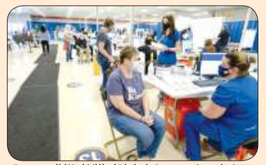
خبراء يحذرون من تجاهل لقاح الإنفلونزا الموسمية

يتعاون فريق من جامعة سوانسي، وكلية كينغز في لندن مع علماء في تشيلي لتطوير نوع جديد من الإسفلت "ذاتي الإصلاح"، لسد شقوقه ذاتياً. وحسب "بي بي سي" فإن الإسفلت مصنوع من نفايات الكتلة الحيوية، باستخدام الذكاء الاصطناعي ويمكنه إصلاح شقوقه دون حاجة إلى صيانة أو تدخل بشري. وحسب خوسيه نورامبويينا