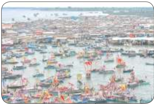
زوارق باجوا المزينة بألوان زاهية تجسد التراث البحري والثقافة

يتجسد مهرجان «ليبيا ليبيا» كأيقونة ثقافية فريدة في شرق ماليزيا حيث تجر الزوارق التقليدية المزينة بزخارف ملونة وأعلام مبهجة لتروي حكاية شعب (باجوا) في حدث سنوي يجمع جمال الطبيعة وعمق التراث. ويشمل المهرجان في مدينة (سيمبورنا) بولاية (صباح) الماليزية فعاليات تحفي بروح الإبداع والتراث بالإضافة إلى تقديم الأطباق والعروض والرقصات التراثية في حدث يعبر عن التناغم الفريد بين الإنسان والطبيعة حيث يعيد البحر رسم الحياة على إيقاع أمواجه الهادئة والمبهية. ويجذب المهرجان الذي أصبح حدثاً وطنياً رسمياً في ماليزيا منذ عام 2003 آلاف السياح سنوياً مما يساهم في دعم الاقتصاد المحلي وتعزيز مكانة (سيمبورنا) باعتبارها وجهة عالمية لحبي الغوص والثقافة البحرية لا سيما أنها تعد بوابة إلى الجزر الاستوائية الشهيرة للغوص واستكشاف أعماق البحار.