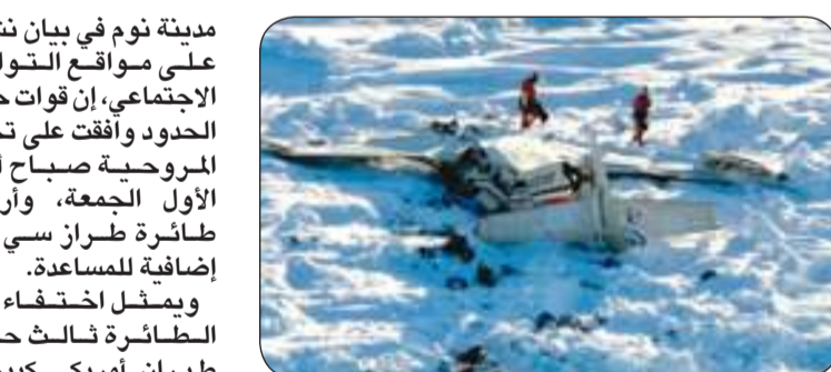
حطام "الطائرة الأمريكية" في ألاسكا

مدينة نوم في بيان نشرته على مواقع التواصل الاجتماعي، إن قوات حرس الحدود وافقت على تحليق المروحية صباح أمس الأول الجمعة، وأرسلت طائرة طراز سي 130 إضافية للمساعدة. ويمثل اختفاء هذه الطائرة ثالث حادث طيران أمريكي كبير في غضون 8 أيام. واصطدمت طائرة ركاب تجارية مع مروحية تابعة للجيش قرب العاصمة واشنطن في 29 يناير، ما أسفر عن مقتل 67 شخصاً. وجي في فيلادلفيا في 31 يناير، ما أسفر عن مقتل 6 أشخاص كانوا على متنها وشخص آخر على الأرض.