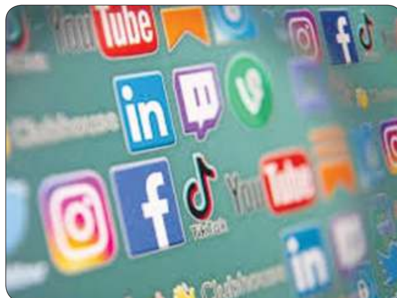
منصات التواصل الاجتماعي

من جانبها، أثارت «تيك توك» مخاوف بشأن أحكام جمعها للتحقق من العمر.. وسيكون أمام المنصات عام لتحديد كيفية تنفيذ القيود العمرية قبل تطبيق العقوبات.