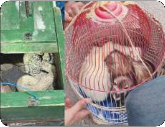
حيوانات مهددة بالانقراض

نجحت السلطات الأمنية المغربية في إحباط محاولات تهريب وبيع غير قانوني لحيوانات و زواحف نادرة، واتخاذ الإجراءات اللازمة بحق المتورطين، مشددة على مواصلة جهودها للتصدي لهذه الجرائم التي تهدد البيئة والسلامة العامة.