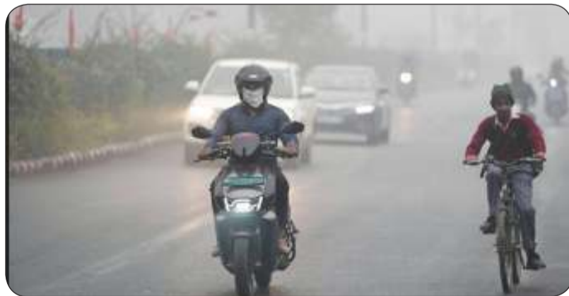
استيقظ سكان نيودلهي على ضباب كثيف

أمراض مزمنة أو مشاكل في الجهاز التنفسي على تجنب الخروج قدر الإمكان. وأثار تدهور جودة الهواء في العاصمة أيضا غضب السكان على وسائل التواصل الاجتماعي. واشتكى كثيرون من الصداع وسعال جاف ومتواصل، ووصفوا المدينة بأنها «كارثية» ومثل «غرفة غاز». وحث آخرون المسؤولين على حل أزمة الصحة العامة بشكل نهائي. ووفقا لتقديرات العديد من الدراسات، فإن أكثر من مليون هندي يموتون كل عام بسبب أمراض مرتبطة بالتلوث.