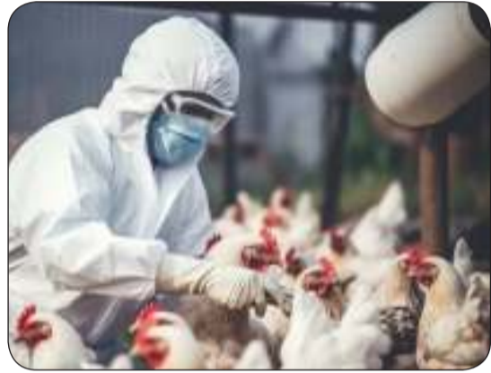
مزرعة دواجن في بريطانيا

قالت الحكومة البريطانية، أمس الأول (الأحد)، إن دواجن في مزرعة تجارية في إنجلترا أصيبت بفيروس إنفلونزا الطيور. وتم العثور على فيروس «إتش 5 إن 1» بين طيور في مزرعة في سانت آيفز، وهي بلدة ساحلية في كورنوال. وذكرت وزارة البيئة والغذاء والشؤون الريفية، إنه سيتم إعدام جميع الدواجن الموجودة في المنطقة المصابة بطريقة إنسانية. وهذا هو أول تأكيد من إنجلترا بشأن وجود فيروس «إتش 5 إن 1» في الطيور هذا الموسم. كما تم العثور على الفيروس مؤخرا في طيور بيرية في جنوب غرب إنجلترا وفي أوروبا، حسبما ذكرت الوزارة. وينتشر فيروس إنفلونزا الطيور «إتش 5 إن 1» في الولايات المتحدة بين الطيور البرية والدواجن والأبقار وغيرها من الحيوانات.