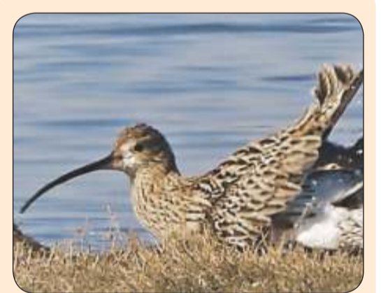
الكروان ربيع المنقار

إن التوسع العمراني المدروس في شمال وجنوب الكويت هو ضرورة ملحة لمواجهة تحديات النمو السكاني، وما مدينة المطالع إلا جزء من هذا التوسع المطلوب.