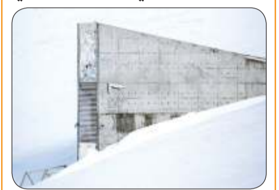
محمية سفالبارد العالمية للبذور

أضفيت إلى «سفينة نوح النباتية»، أكبر محمية بذور في العالم تقع في القطب الشمالي، عشرات الآلاف من البذور بعضها من أصل فلسطيني، في وقت تشهد فيه غزة حرباً ونقصاً حاداً في الغذاء.