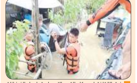
فرق الإنقاذ تجلب سكان القرى التي حاصرتها مياه الفيضانات

لقد اعتبرت أحداث فيلم «اليوم التالي غدا» الخيالية، التي تتنبأ ببعض تغييرات مناخية خطيرة. تقوم هذه الدورة بتوزيع الحرارة في المحيط، لكن الأبحاث تشير إلى أنها تعاني من التباطؤ، وقد تصل إلى نقطة تحول قريبة. مع ارتفاع درجات الحرارة العالمية، تذوب الأنهار الجليدية، مما يؤدي