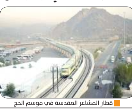
قطار المشاعر المقدسة في موسم الحج

انطلق فجر أمس الأول قطار المشاعر المقدسة في أولى رحلاته لموسم الحج لعام 1445، لخدمة ضيوف الرحمن في تنقلاتهم بين المشاعر المقدسة في منى وعرفات ومزدلفة، عبر محطاته التسع المنتشرة بها.