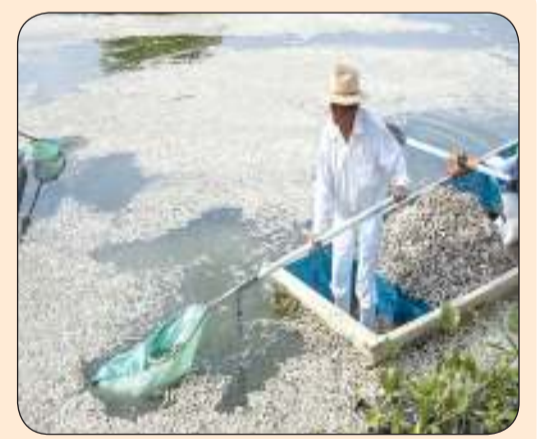
الجفاف يسبب بنفوق آلاف الأسماك في إحدى بحيرات المكسيك

ويقول "إذا أقدم أشخاص آخرون على فعل ذلك، قد تغضب فوق النطق".