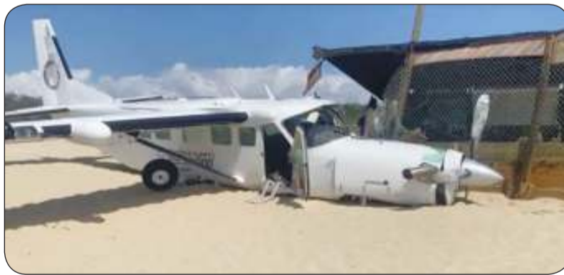
الطائرة هبطت فوق رؤوس رواد الشاطئ

حالتهم بـ«المستقرة». هذا ولم تتوفر معلومات فورية عن سبب سقوط الطائرة حتى اللحظة.