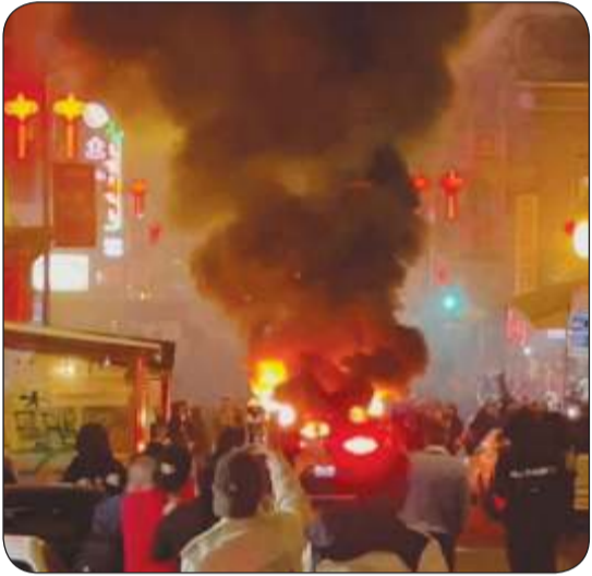
جانب من احراق سيارة ذاتية القيادة في سان فرانسيسكو

تعرضت سيارة أجرة ذاتية القيادة من شركة «وايمو» التابعة لمجموعة «ألفابت»، الشركة الأم لـ «غوغل»، للتخريب وأحرقت بالكامل من أشخاص عدة مساء السبت الماضي في سان فرانسيسكو (كاليفورنيا)، من دون وقوع أي إصابات، أثناء سيرها في المدينة من دون أي راكب فيها.