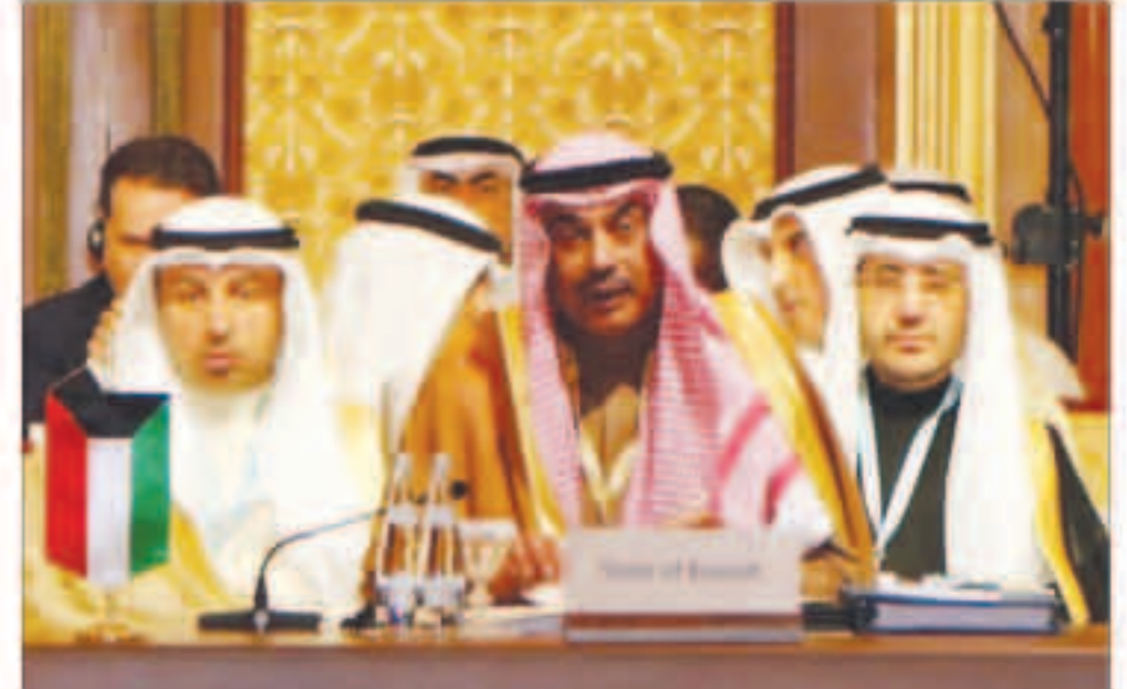
الشيخ صباح الخالد خلال حضوره اجتماعات الدورة الـ46 لمجلس وزراء خارجية منظمة التعاون الإسلامي

ابوظبي - «كونا»: أكد نائب رئيس مجلس الوزراء وزير الخارجية الشيخ صباح الخالد أمس الأول حرص الكويت على رفع المعاناة عن كاهل المنكوبين في الأمة الإسلامية والدفع بالحلول السلمية لكافة القضايا المطروحة أمام منظمة التعاون الإسلامي. جاء ذلك في الكلمة التي ألقاها الخالد في افتتاح اجتماعات الدورة الـ46 لمجلس وزراء خارجية منظمة التعاون الإسلامي التي عقدت أعمالها في العاصمة الإماراتية ابوظبي. وقال الخالد «يجتمع مجلسنا في دورته الـ46 والتي تتزامن مع الذكرى الخمسين لتأسيس منظمتنا العريقة والتي أنشئت عام 1969 جراء حريق المسجد الأقصى» مضيفاً «أن هذه الذكرى تدعونا جميعاً إلى المراجعة والتأمل فيما تحقق من إنجازات خلال تلك المسيرة الطويلة المحافطة ومقدين هنا ما أنجز حتى الآن من دعم لأواصر العلاقات