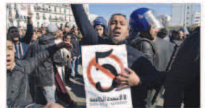
جانب من الاحتجاجات في الجزائر

الجزائر: وفاة وإصابة 183 خلال المسيرات الراضية لترشح بوتفليقة