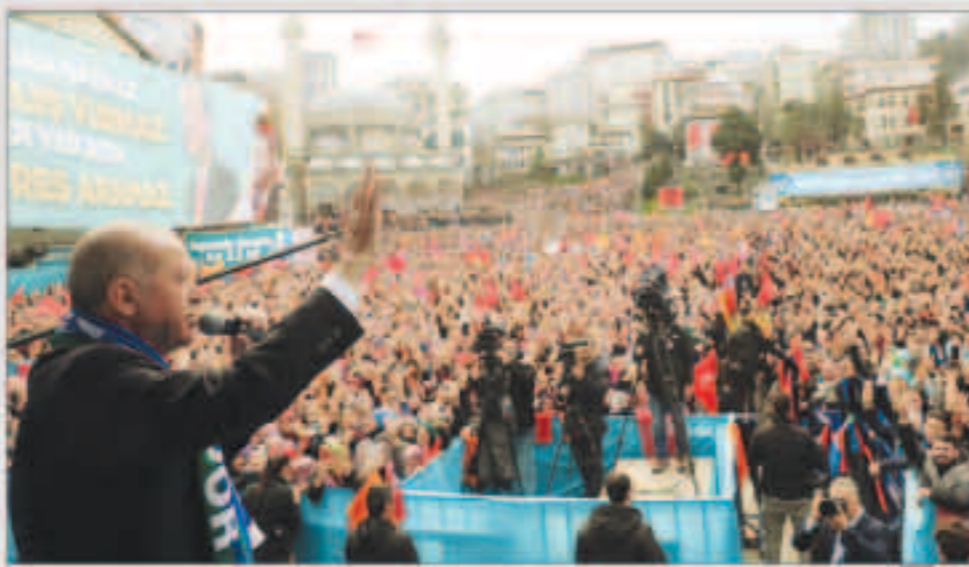
الرئيس التركي أردوغان في كلمة أمام تجمع جماهيري بمدينة «إزمير»

■ الرئيس التركي: مستعدون للقيام بكل ما بوسعنا لتهدئة التوتر فالتصعيد وصب الزيت على النار لا يفيدان أحداً