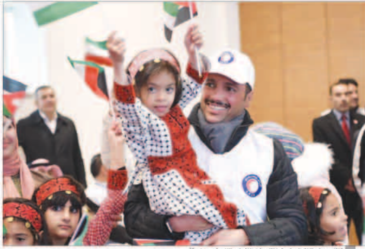
الغانم يحمل طفلة فلسطينية خلال زيارته للاجئين الفلسطينيين في الأردن

■ بقدر ما يحزننا ما نراه من معاناة تعرضت لها شعوب مسلمة إلا أنه في نفس الوقت نفتخر ونعتز بأننا لم تترك وحيدة ■ الأردن تحملت أكثر مما يمكن أن تحتل وفتحت أبوابها ومنازلها وطرقها وقلوب أبنائها للاجئين ■ نأمل أن تستمر أعمال الخير وأن يستمر الشعب الكويتي في دعم إخوانه سواء الفلسطينيين أو السوريين ■ أحيي الفرسان المجهولين للهلال الأحمر الكويتي وأثمن عالياً جهودهم الدؤوبة في تقديم المساعدات الإنسانية ■ زيارتنا للمنكوبين تأتي انطلاقاً من حرص الكويت على هذا الملف الإنساني الأساوي ودعم المحتاجين