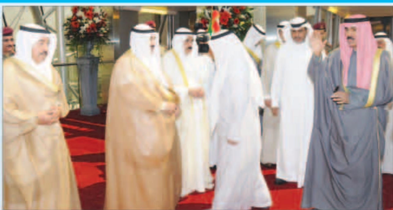
سمو ولي العهد الشيخ نواف الأحمد لدى مقارنته إلى الولايات المتحدة أمس