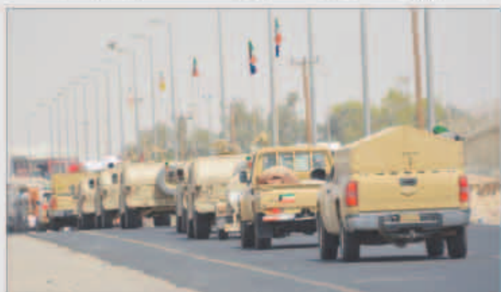
القوة الكويتية المشاركة في تمرين «درع الخليج» المشتركة، عادت إلى البلاد

■ رئيس الأركان: الجيش الكويتي حريص على التقيد بقواعد القانون الدولي الإنساني ■ نولي اهتماماً بالغاً بنشر الوعي والثقافة في مجال العمليات العسكرية بين منتسبي قواتنا المسلحة