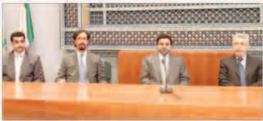
وزير الأوقاف، المركز الإسلامي وجامع روما الكبير يعززان حوار الثقافات