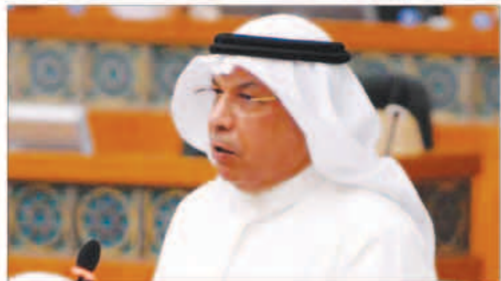
نائب رئيس الوزراء وزير الداخلية الشيخ خالد الجراح

تعقد اجتماعاتها المقبلة في الأرجنتين وليها اليابان