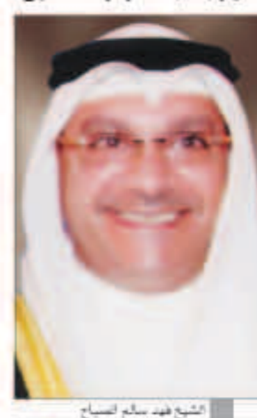
الشيخ فهد سالم الصباح

لندن - «كويتا»: أكد رئيس الجهاز الفني لبرنامج التخصيص الكويتي الشيخ فهد سالم الصباح، أن الحكومة الكويتية ماضية في تنفيذ برنامج التخصيص كهدف استراتيجي في المرحلة المقبلة، لتوفير آلاف الفرص الوظيفية لأبنائنا. وقال الشيخ فهد الصباح في تصريح لـ «كويتا»، على هامش زيارته إلى لندن، أن «القادمين لسوق العمل خلال العامين المقبلين، سيصلون إلى عشرات الآلاف سنوياً، ومن الصعب على الحكومة