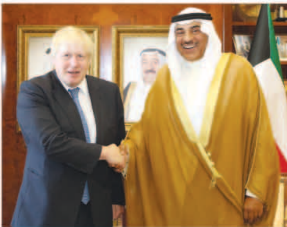
الشيخ صباح الخالد لدى استقباله وزير الخارجية البريطاني بوريس جونسون

قلقون مما يحدث ونناشد جميع الأطراف ضرورة الاستعجال باحتواء الاحتقان السياسي عبر الحوار