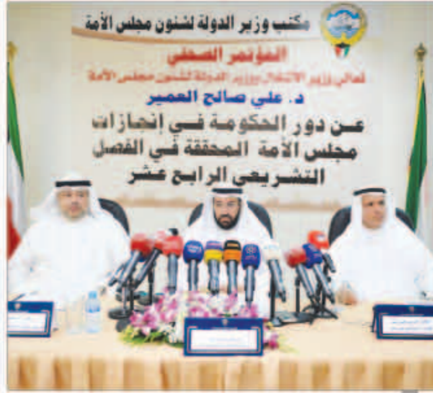
د. علي العمير خلال مؤتمره الصحفي امس

لدينا مشروع تنموي لاستكمال طريق الدائري الأول وأخذنا جميع الموافقات بشأن تنفيذه مجلس الأمة الحالي أنجز 441 تشريعاً شاملة القوانين والمراسيم والاتفاقيات والميزانيات والحسابات الختامية بعض القوانين المنجزة تشكل نقلة نوعية في البنية التشريعية للكويت كالسماح للمواطن بالظعن المباشر أمام المحكمة الدستورية هذا الفصل التشريعي سجل رقماً قياسياً في عدد الاستجابات الذي بلغ 20 استجواباً