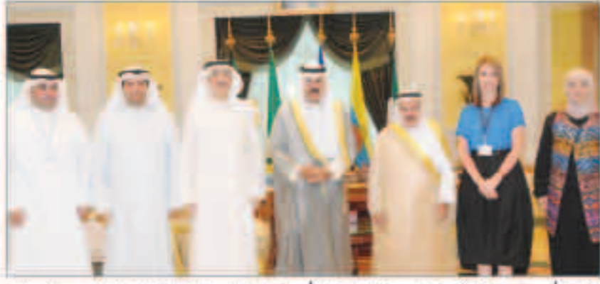
نائب الأمير يدعو القائمين على منته نواف الأحمد إلى الإسراع في إنجاز هذا الصرح المعماري