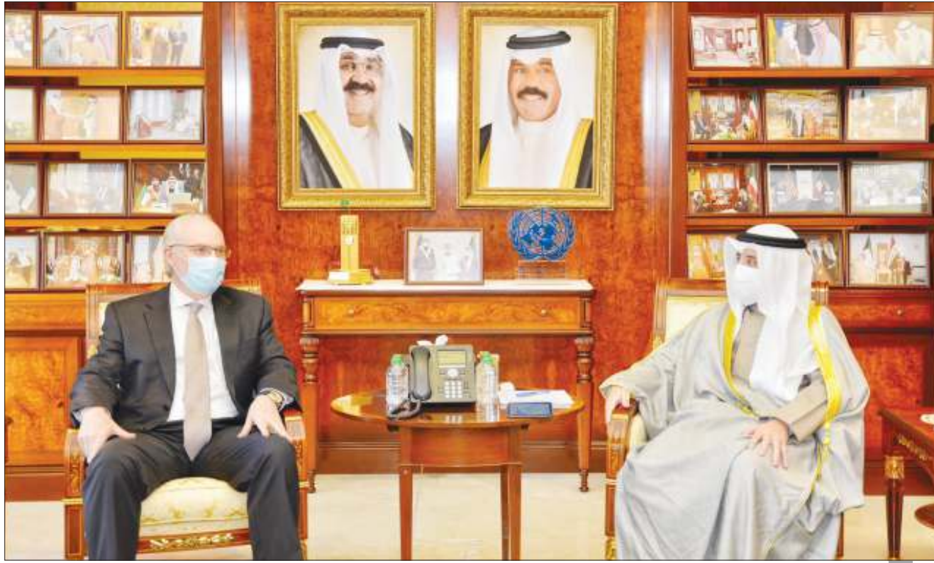
وزير الخارجية الشيخ أحمد الناصر خلال استقبال مبعوث الولايات المتحدة الأمريكية الخاص إلى اليمن تيم ليندركنغ

نؤكد أهمية دور الولايات المتحدة ومساعدتها في إنهاء الأزمة ومساعدتها الإنسانية والتنموية للشعب اليمني الضغط على الميليشيات الحوثية لوقف الهجمات والاعتداءات التي تستهدف الضواحي والمنشآت المدنية الهجمات المستمرة والمتكررة على أراضي السعودية تعد تهديدا مباشرا للأمن القومي الخليجي والعربي