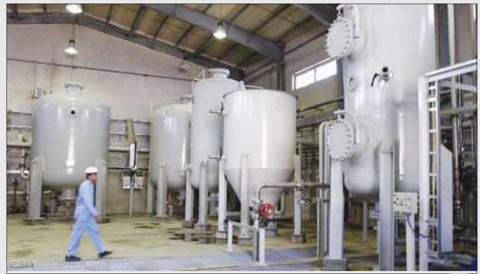
إيران ترفض العودة للاتفاق النووي قبل رفع الحظر عنها

المكراد : رجال الإطفاء يخاطرون بأنفسهم لحماية الأرواح والممتلكات