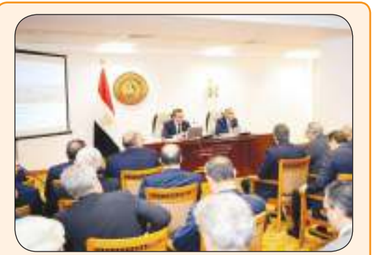
عبد العاطي يستعرض خطة إعمار غزة بحضور سفراء الدول والمنظمات الدولية

مصر: يمكن نشر قوات دولية بغزة والضفة وفق برنامج يؤسس لدولة فلسطينية