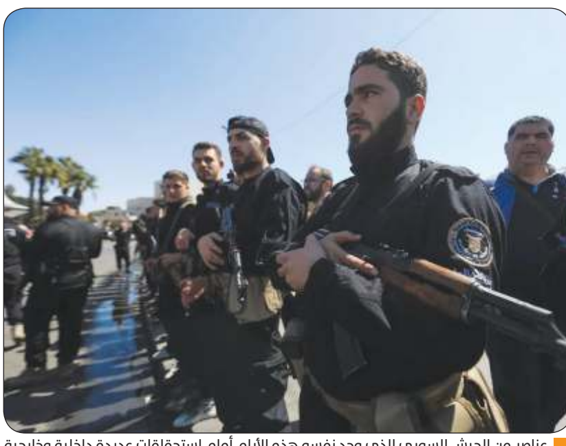
عناصر من الجيش السوري الذي وجد نفسه هذه الأيام أمام استحقاقات عديدة داخلية وخارجية

الجيش اللبناني: تجري اتصالات مع سلطات سوريا لضبط الأمن عند الحدود وسلمناهم جثث القتلى