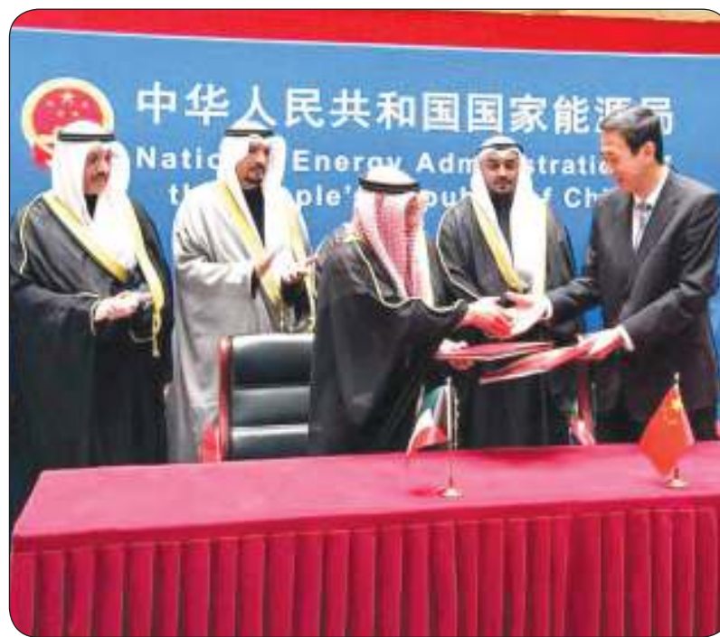
الجانبان الكويتي والصيني يتبادلان وثائق التوقيع على اتفاقية التعاون المشترك

دمشق حملت «حزب الله» المسؤولية.. والحزب ينفي علاقته بما جرى