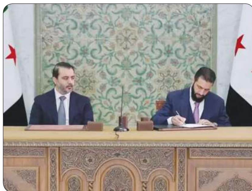
الرئيس أحمد الشرع يوقع مسودة الإعلان الدستوري الجديد

كفالة حقوق المرأة وحرية الرأي والإعلام والتعبير واحترام الدولة لقوانين حقوق الإنسان