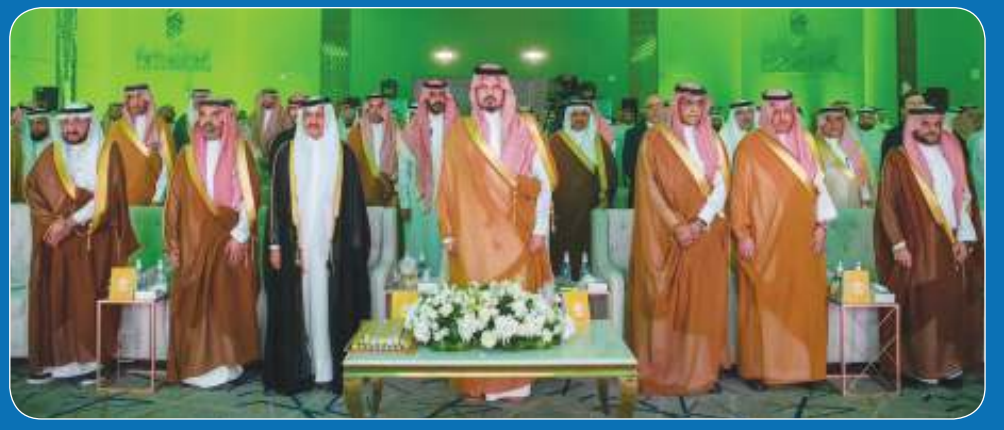
أمير المدينة المنورة رعى افتتاح أعمال منتدى «منافع» 06

الجمعة 14 رمضان 1446 هـ 14 مارس 2025 م السنة السابعة عشرة