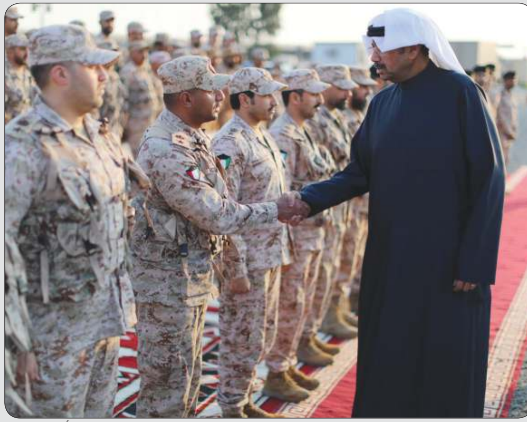
الوزير الشيخ عبد الله العلي مع رجال قوة «واجب مبارك» بالمنطقة الشمالية لدى زيارته لهم مساء أمس الأول

بعض بنود قانون «التأمينات» تم تعديلها وأخرى في الطريق.. والزوجات المسحوبة جنسياتهن سيحصلن على رواتبهن التقاعدية حتى الوفاة بلادنا مرت بمرحلة عصيبة تمنى ألا تعود لها مرة أخرى والمحافظة على الأمن لا تأتي من فراغ