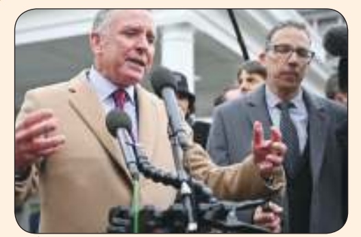
المبعوث الأمريكي وينكوف يتحدث إلى الصحفيين في واشنطن قبل أيام