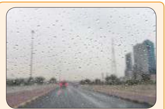
«الأرصاد» توقع استمرار الأمطار حتى السبت