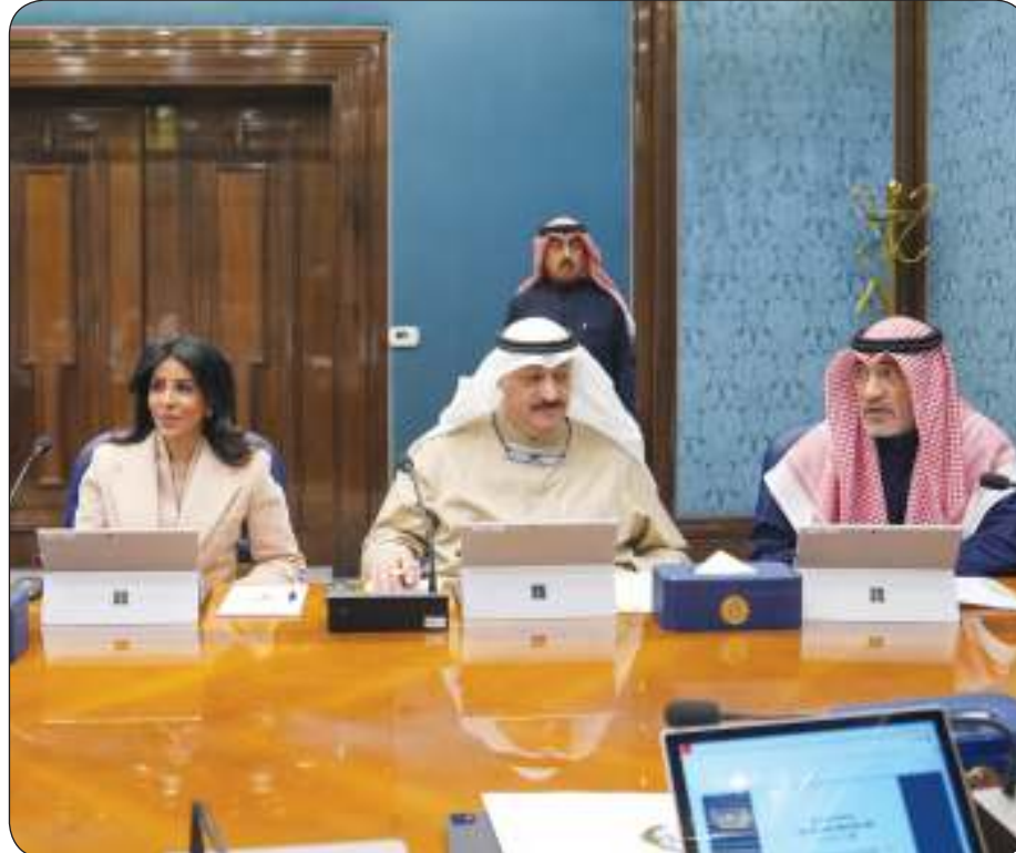
الشيخ فهد اليوسف مترئسا الاجتماع الأسبوعي لمجلس الوزراء أمس

توقيع اتفاقية بين الحكومة والشركة العالمية تتضمن إنشاء مراكز لبيانات «الذكاء الحديث» و«التميز للحوسبة السحابية» طرح مبادرة تأهيل شاملة تهدف إلى تزويد الكوادر الوطنية بالمهارات الأساسية في هذا المجال لضمان جاهزية لسوق العمل مستقبلاً الموافقة على عدد من الموضوعات المدرجة بجدول الأعمال وإحالة أخرى إلى اللجان الوزارية المختصة لدراستها وإعداد تقارير بشأنها