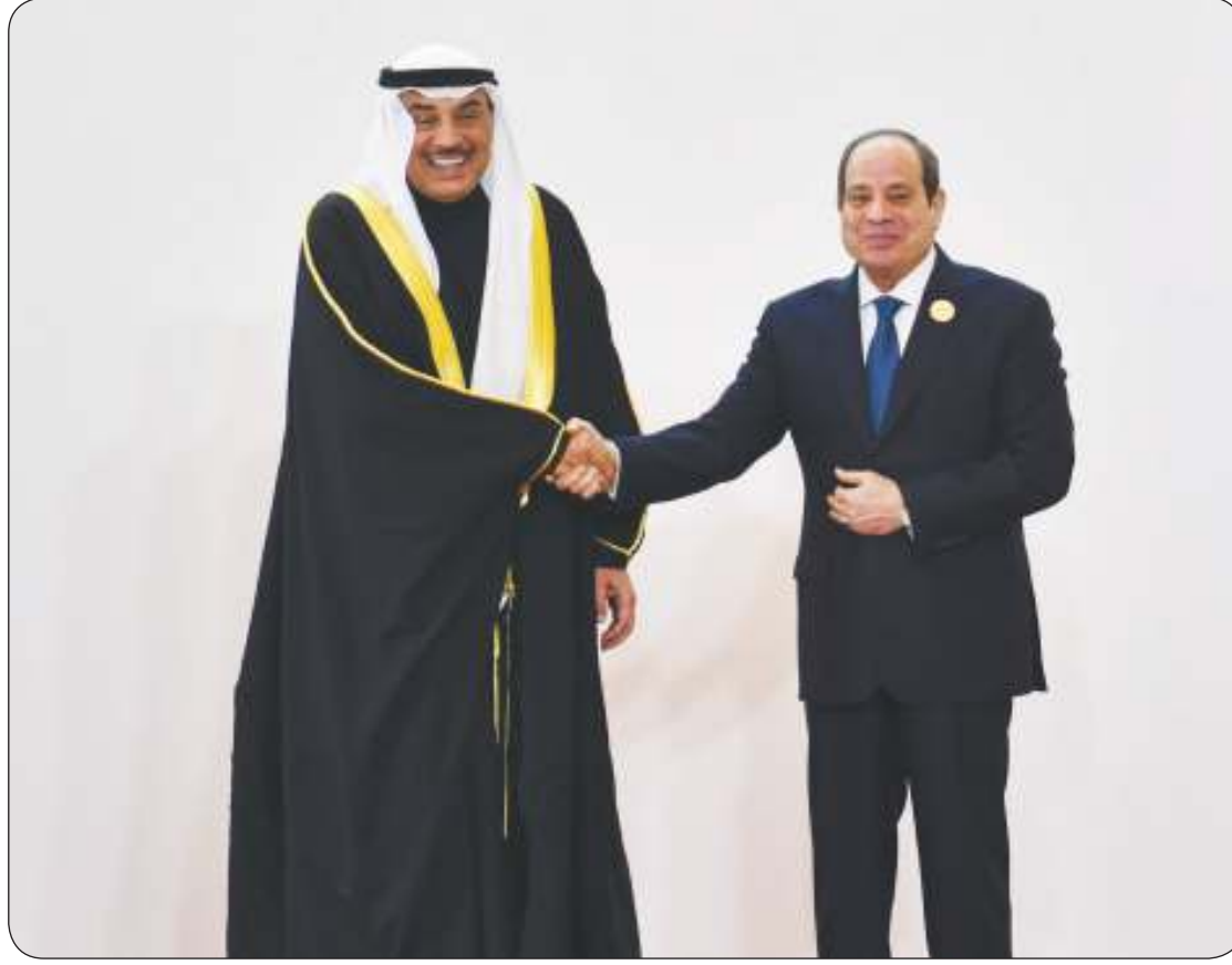
الرئيس السيسي مرحباً بممثل صاحب السمو الأمير سمو ولي العهد الشيخ صباح الخالد

ضرورة صياغة خطة لإعادة إعمار غزة بمشاركة فلسطينية وعربية ودولية تتناول كل الجوانب التنموية والإنسانية والاقتصادية السياسي: الخطة المصرية تضمن بقاء الشعب الفلسطيني في أرضه وإعادة بنائها وتدعو إلى حشد الدعم الدولي والإقليمي لها ملك البحرين: السلام الدائم هو الإطار الضامن لحصول الشعب الفلسطيني على حقوقه المشروعة الملك عبد الله الثاني: يجب وقف التصعيد الخطير في الضفة الغربية ورفض قرار إسرائيل منع دخول المساعدات الإنسانية إلى غزة عباس: تعيين نائب للرئيس ومستعدون لإجراء انتخابات رئاسية وتشريعية خلال العام المقبل في الضفة وغزة والقدس الشرقية