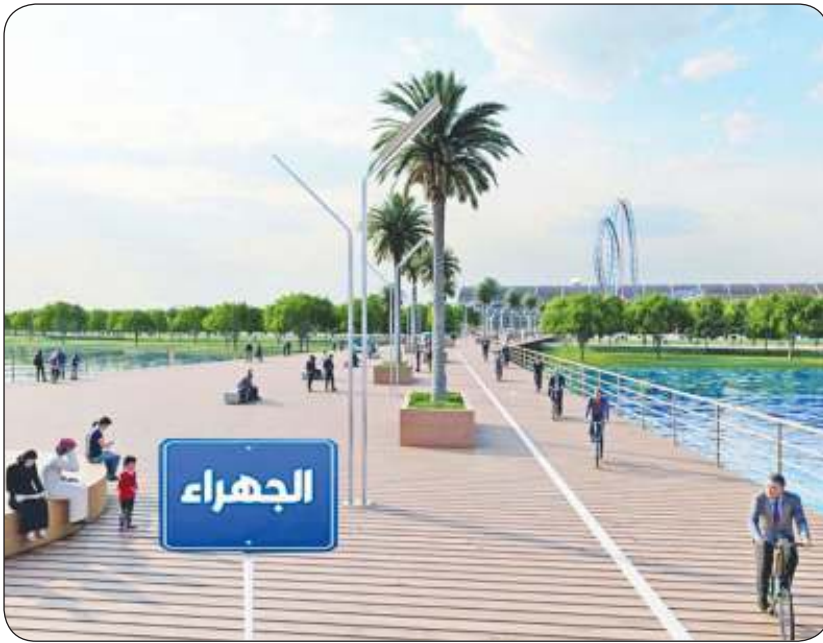
حلم أهالي الجهراء بتنفيذ مشروع الكورنيش في طريقه إلى التحقيق

المشعان: مواصلة أعمال الصيانة الجذرية لطرق «عبد الله المبارك» ضمن العقود الجديدة الموسوي: فرق «الأشغال» موجودة بين القطعتين 2 و 4 بالمنطقة لمتابعة فرش طبقة أسفلتية بسماكة 5 سنتيمترات